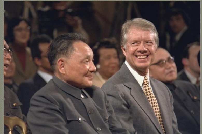
Джимми Картер и Дэн Сяопин во время визита в США в 1979 году

Дэн также стал инициатором создания особых экономических зон в Китае (политика открытых дверей), благодаря которым в страну привлекаются иностранные компании и инвестиции.