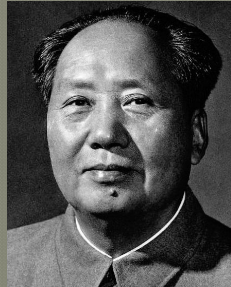
Мао Цзэдун, на момент 1949 года 1-ый Председатель ЦК КПК Китая, с 1954 года 1-ый председатель КНР

Построение социализма в Китае предполагало тесный союз с СССР и получение от него всесторонней помощи.