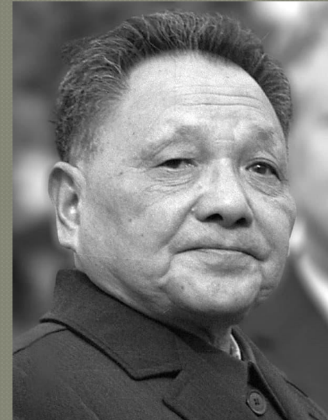
Дэн Сяопин, автор принципа «социализма с китайской спецификой» и инициатор экономических реформ в Китае

Не желая идти по пути Н. С. Хрущёва, в 1982 году Дэн объявил, что «Мао был плохим на 30%, но хорошим на 70%», а также возложил всю вину и ответственность за «культурную революцию» на контрреволюционные силы.