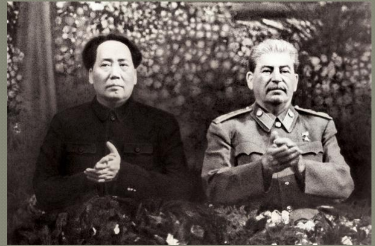
И. В. Сталин и Мао Цзэдун во время визита в Москву в 1949 году

Был ликвидирован сначала класс помещиков, а затем в середине 50-х годов как класс была уничтожена буржуазия в городе и деревне. Безземельные крестьяне получили землю.