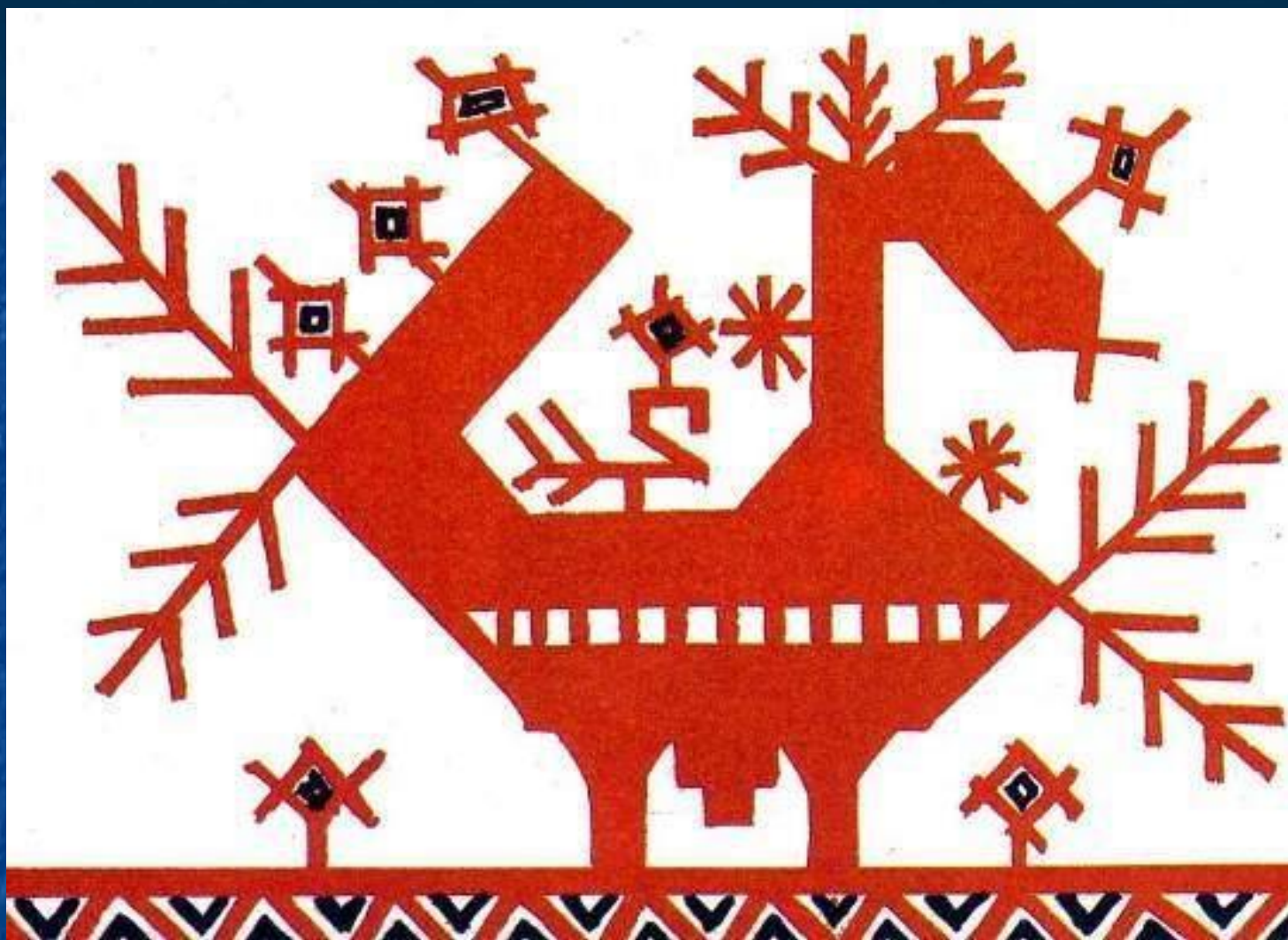
Птица в орнаментальном мотиве. Вышивка. Россия.