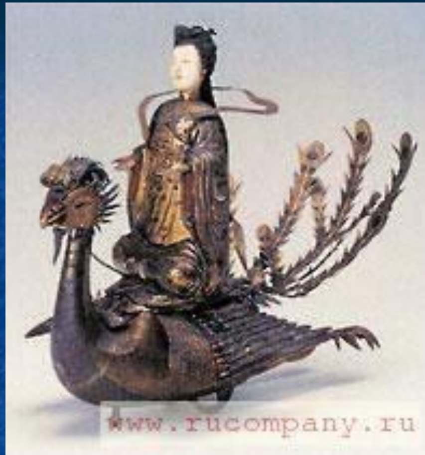
Заводная игрушка «Богиня Сиванму на фениксе». Китай. Металл, слоновая кость. Из коллекции Кунсткамеры (1718 г.)