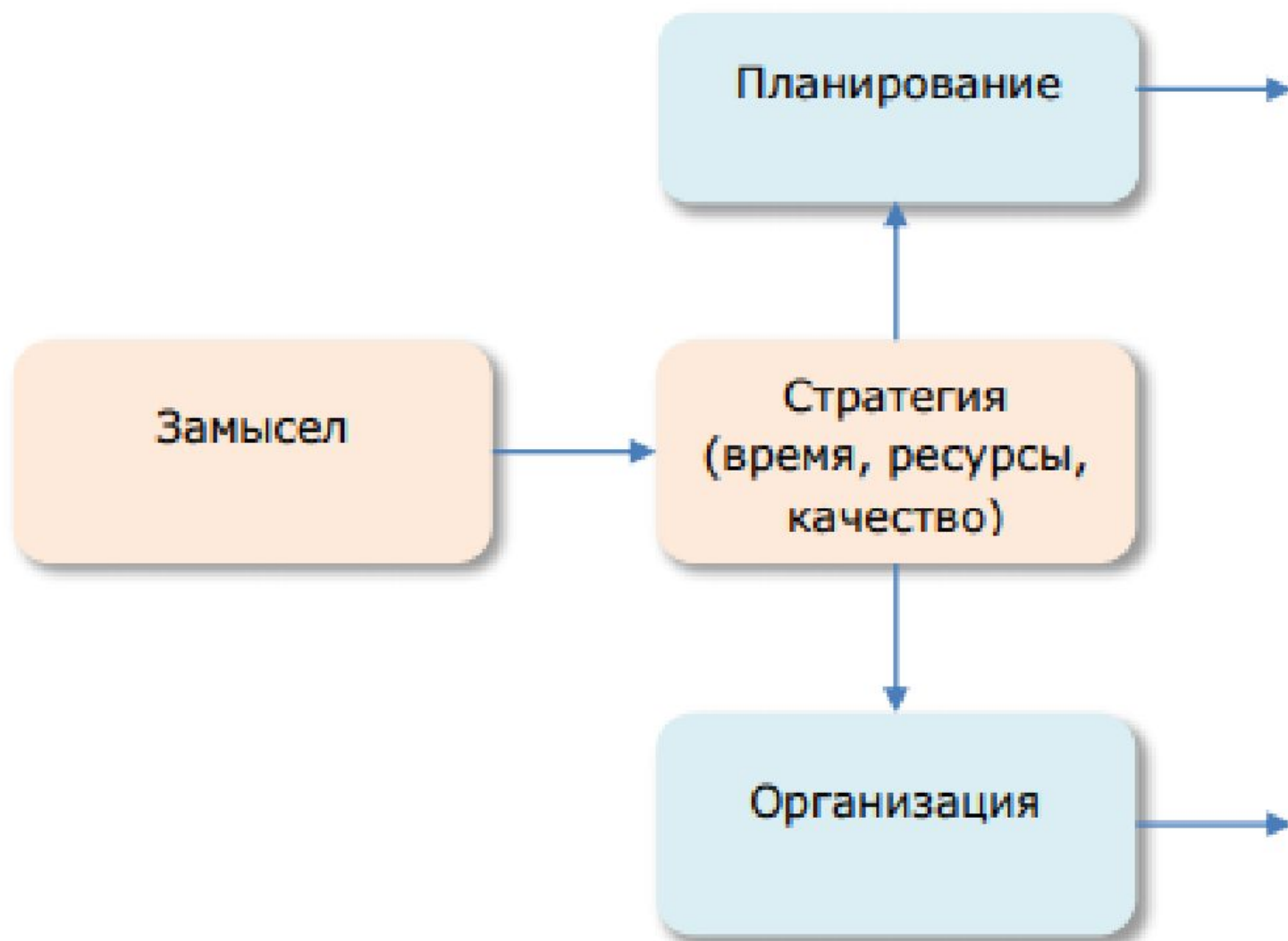
Рис. 8. Начало реализации проекта