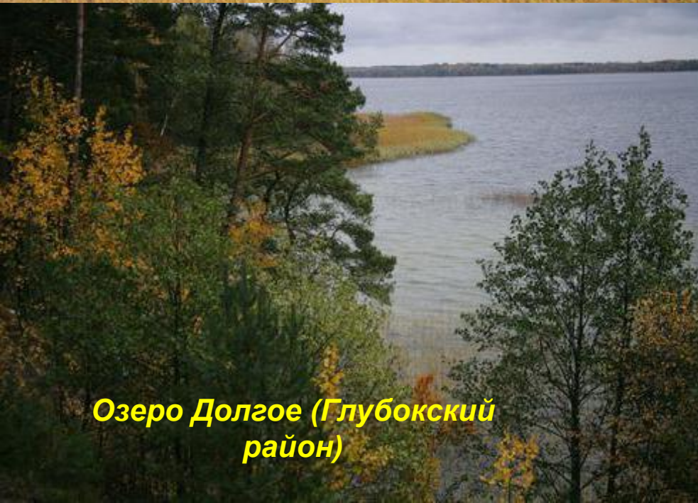
Озеро Долгое (Глубокский район)