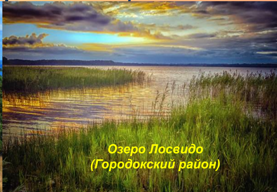
Озеро Лосвидо (Городокский район)