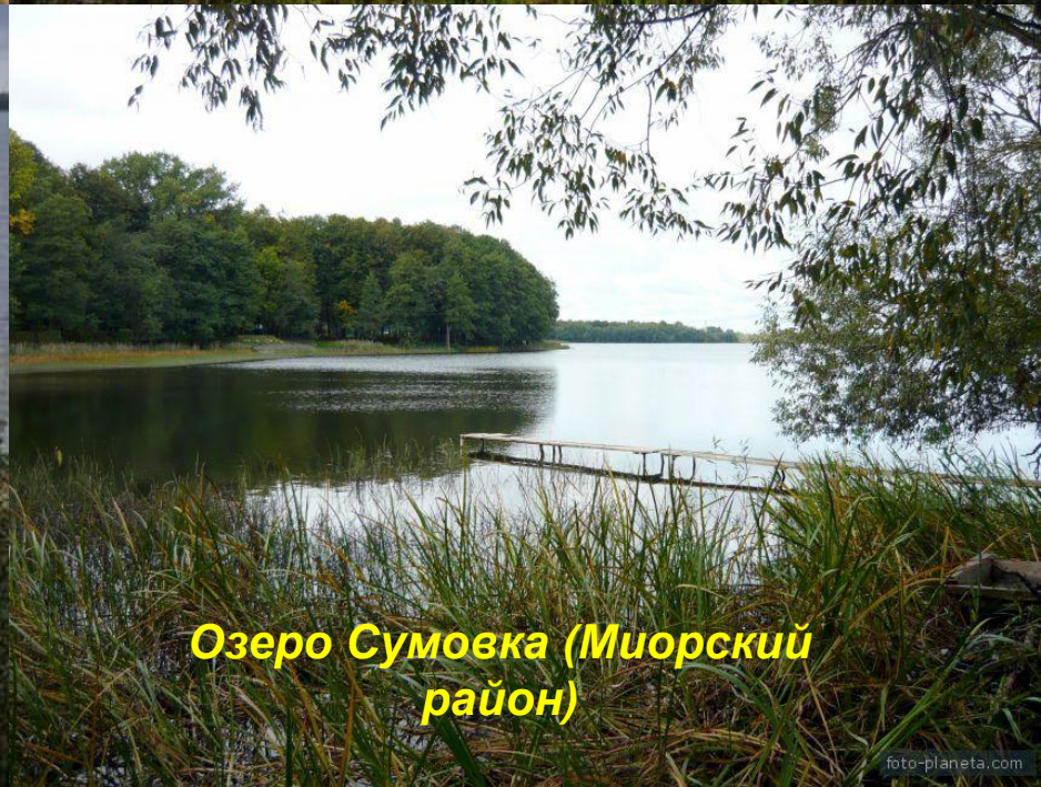
Озеро Сумовка (Миорский район)