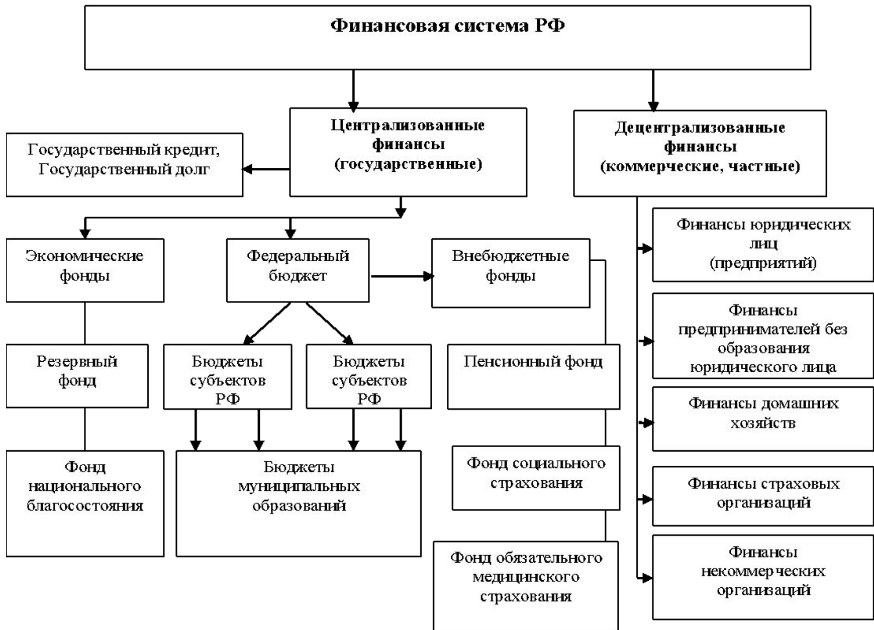
Рисунок 1. Финансовая система