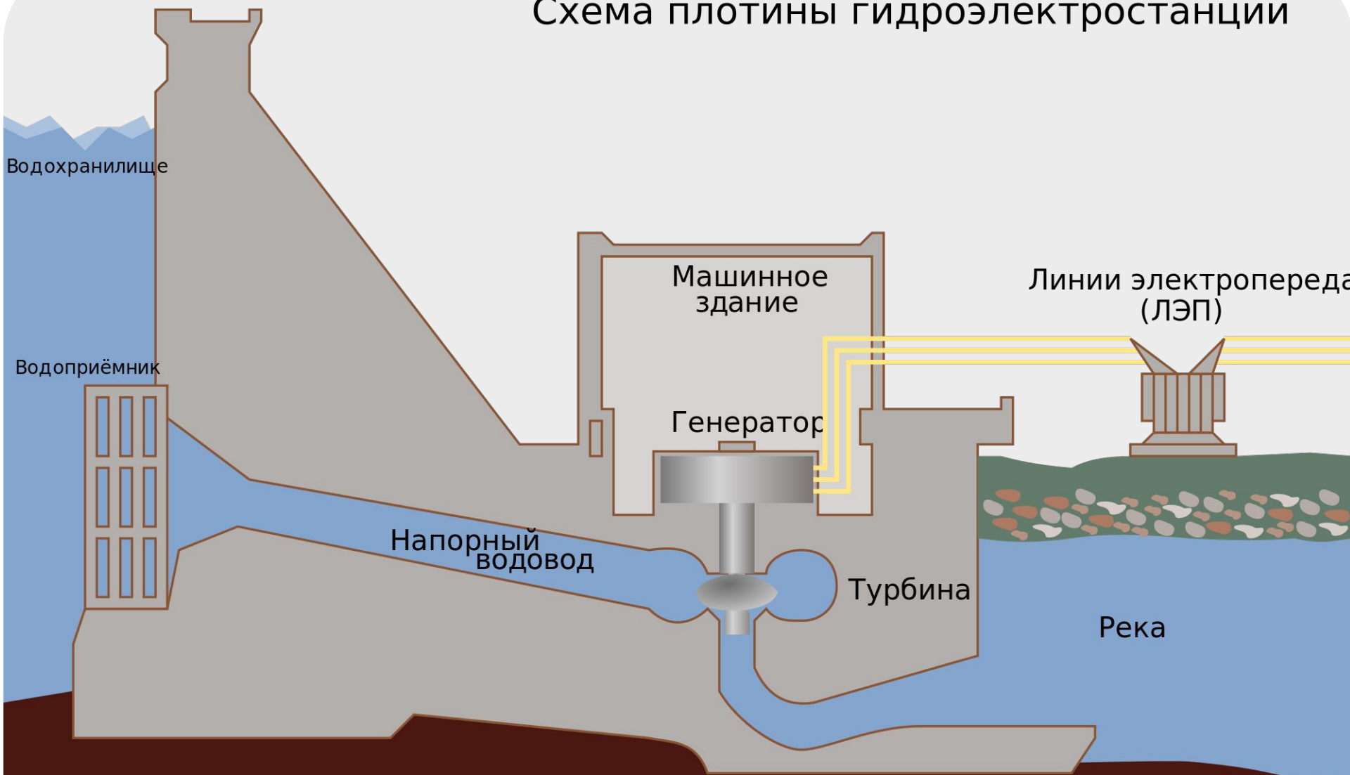
Схема плотины гидроэлектростанции