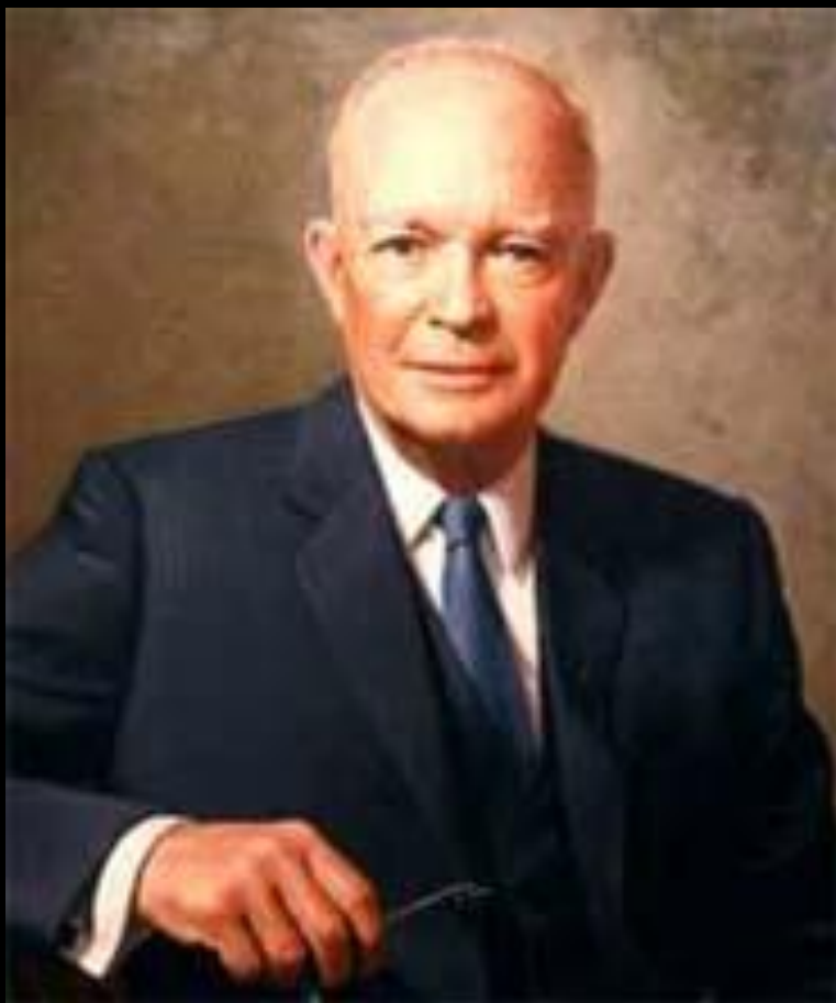
■ Дуайт Эйзенхауэр