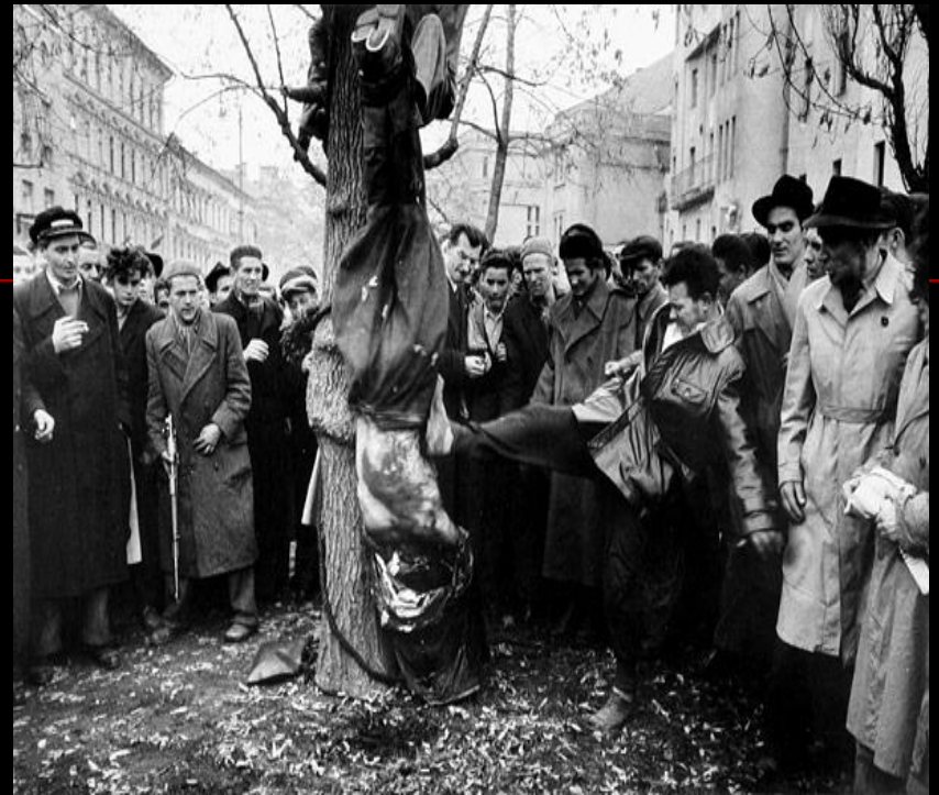
Повешенный вниз головой изуродованный труп сотрудника ГБ