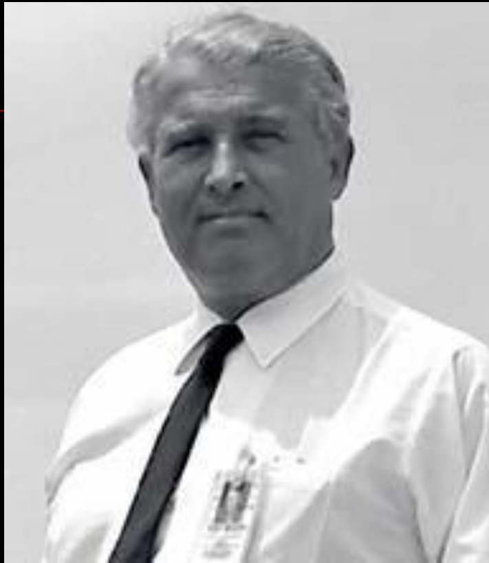
■ Вернер фон Браун