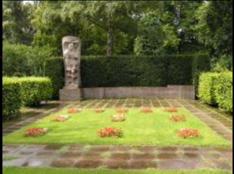
■ Братская могила и музей 11 погибших берлинцев на кладбище-колумбарии Зеештрассе

■ Берлинский кризис июня 1953 года (широко известно как «Берлинское восстание»; в Германии — как «Народное восстание 17 июня») — массовые антиправительственные народные выступления в ГДР 16—17 июня 1953 года. ■ Подавлено с помощью советских войск.