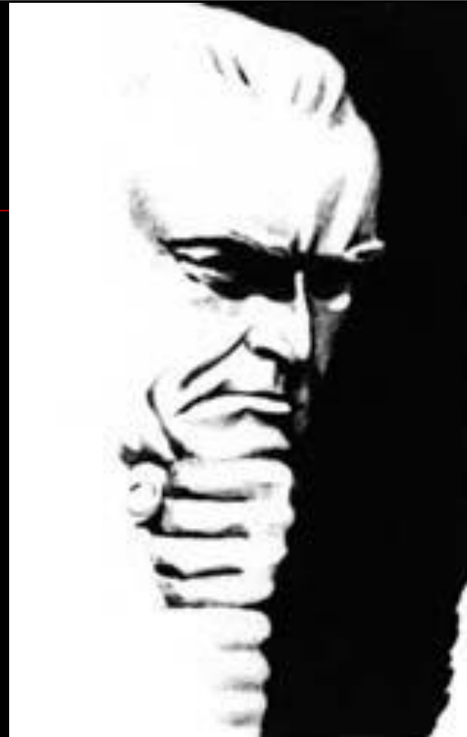
■ Сергей Королев.