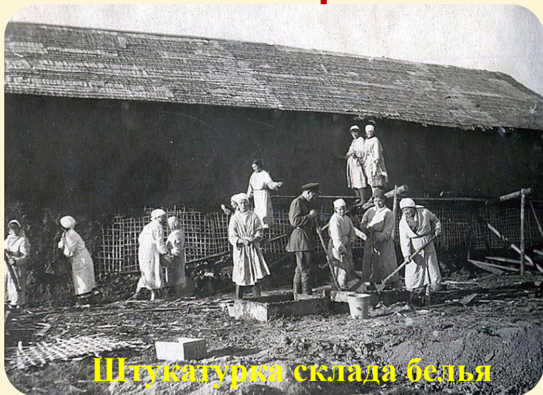
Штукатурка склада белья