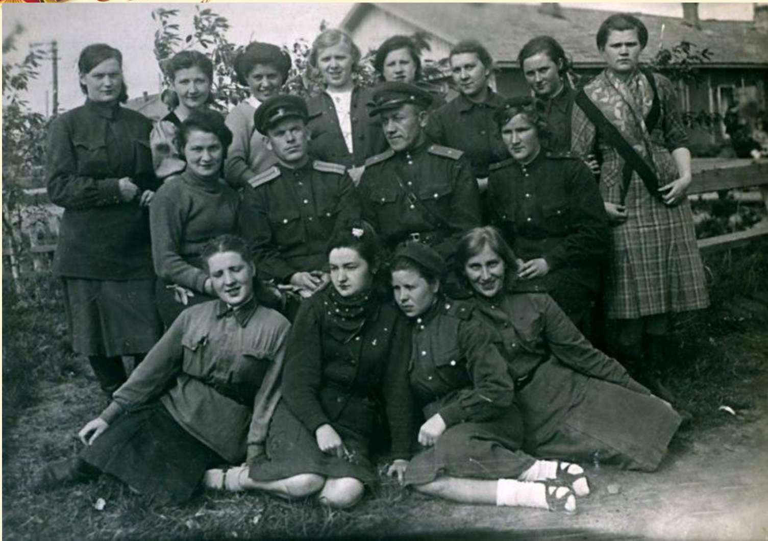
Комсомольская организация госпиталя