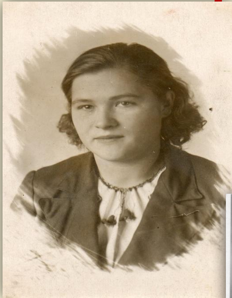
п. Шексна, 1943 год