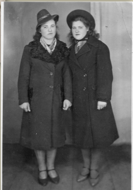
г. Каунас, 1945 год

Родилась 20 августа 1924 года в д. Подолец, Угольского с/с.