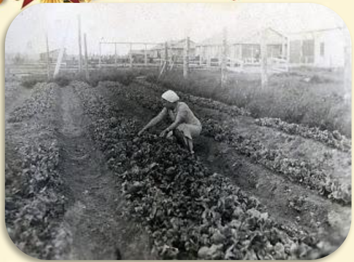
Подсобное хозяйство госпиталя