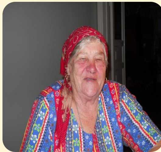
Октябрь 2010 г.