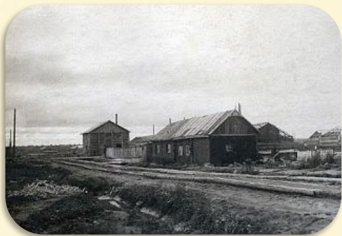
Швейная мастерская госпиталя

Трудовой день по законам военного времени длился 12 часов, с 9 утра до 21 часа – это была основная работа, а всё остальное время отдавали общественной работе. Трудно было с питанием, госпиталь организовал подсобное хозяйство. В первых рядах трудились комсомольцы: вскапывали грядки, пололи, убирали урожай. Раненым не хватало витаминов, был брошен клич «На сбор ягод!», и опять впереди были комсомольцы эвакогоспиталя.