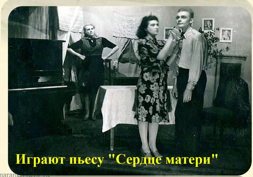
Играют пьесу "Сердце матери"