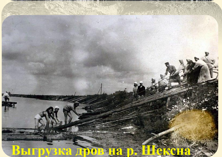
Выгрузка дров на р. Шексна

Эвакогоспиталь №1327 был сформирован в Ленинградской области, в городе Пушкине, а 19 августа 1941 года эвакуирован в посёлок Шексна Вологодской области, где и развернул свои 18 отделений на берегу реки. В сентябре 1941 года поступили первые раненые. Трудно было начинать работу, пришлось самим штукатурить бараки, проводить водопровод, электричество, заготовливать дрова.