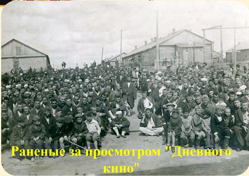
Раненые за просмотром "Дневного кино"