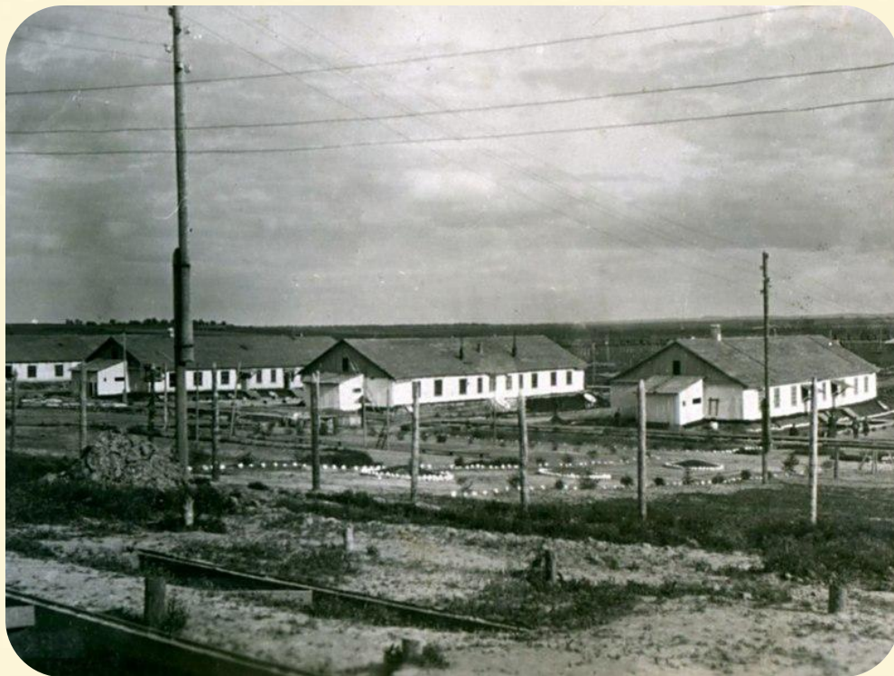
Общий вид на бараки выздоравливающих

Госпиталь был развёрнут в короткий срок и в сентябре 1941 года уже принял первых раненых. Их доставляли железнодорожным транспортом с Ленинградского фронта. Для удобства была проложена железнодорожная ветка (около Музлесдрева). Санитарные поезда шли почти каждый день. Раненых в госпитале постоянно находилось около двух тысяч. Только в одном из барачных корпусов располагалось 280 коек, мест не хватало, был установлен второй ярус. За 3 года, с сентября 1941-го по ноябрь 1944-го через эвакогоспиталь №1327 прошло около 50 тысяч раненых.