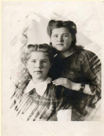
г. Хабаровск 1946 год