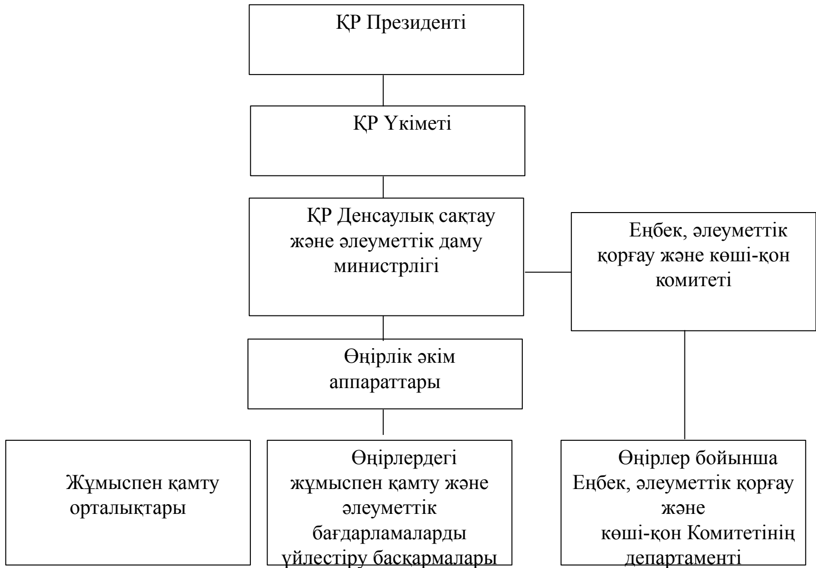
Сурет 2 - Халықты жұмыспен қамтуды мемлекеттік реттеу құрылымы