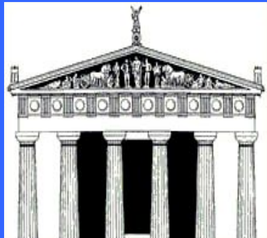
Храм Зевса в Олимпии

античности справлялись в честь Зевса Олимпийского через каждые четыре года, летом, в Элиде (области на северо-западе Пелопоннеса) в Священном городе Олимпии у подножия горы Олимп.