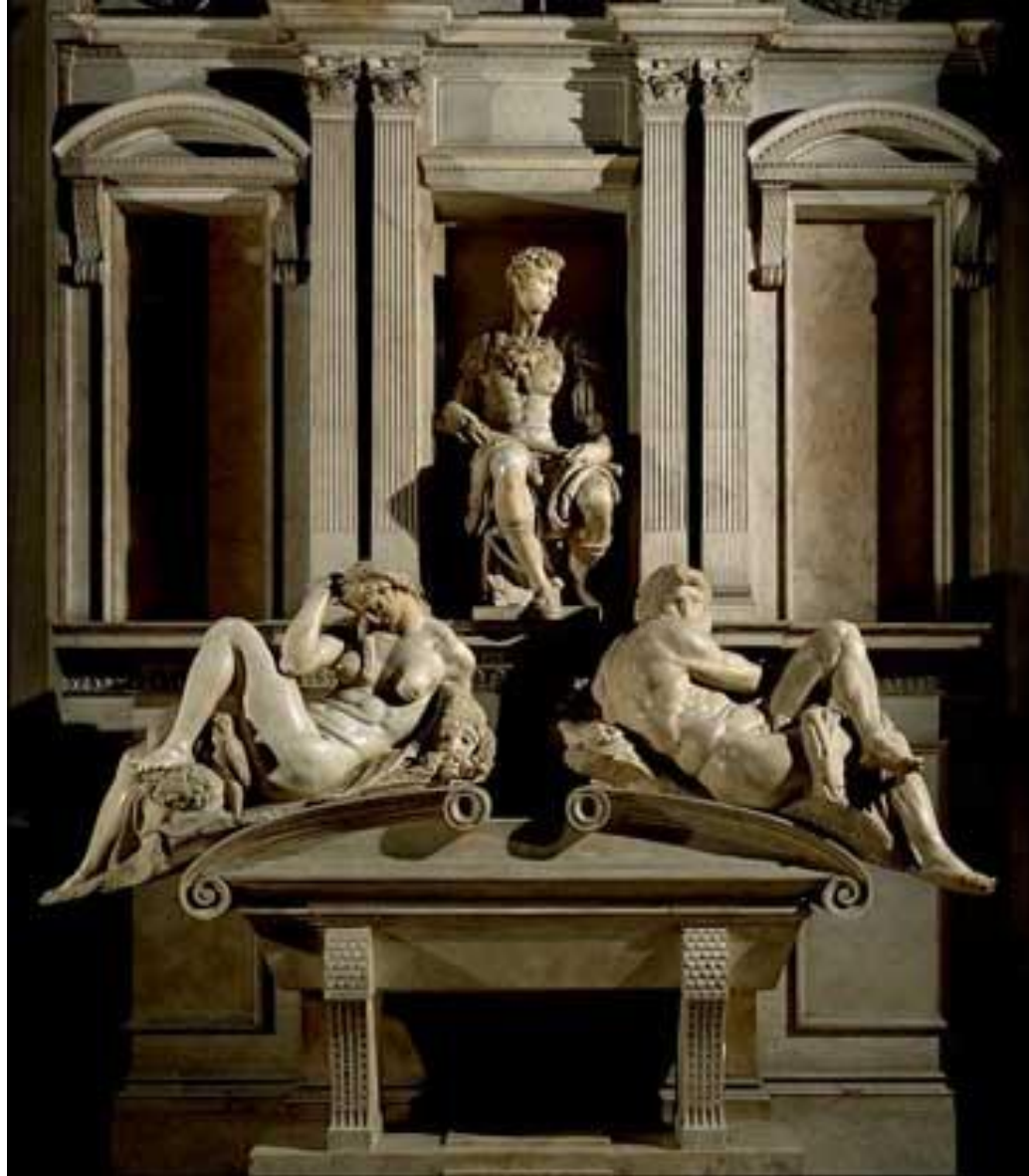
Надгробие Джулиано Медичи Микеланджело