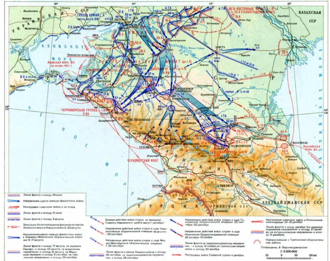
БИТВА ЗА КАВКАЗ. ОБОРОНИТЕЛЬНЫЕ ОПЕРАЦИИ 25 июля – 31 декабря 1942 г.