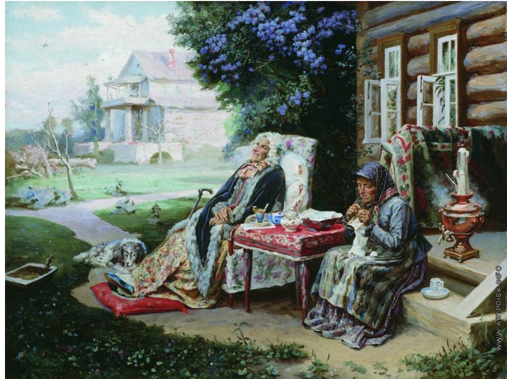
Худ. В. Максимов «Всё в прошлом»

Имелись ли у помещиков желание и возможности после 1861 году осуществлять власть в деревне, следить за содержанием дорог, школ, больниц?