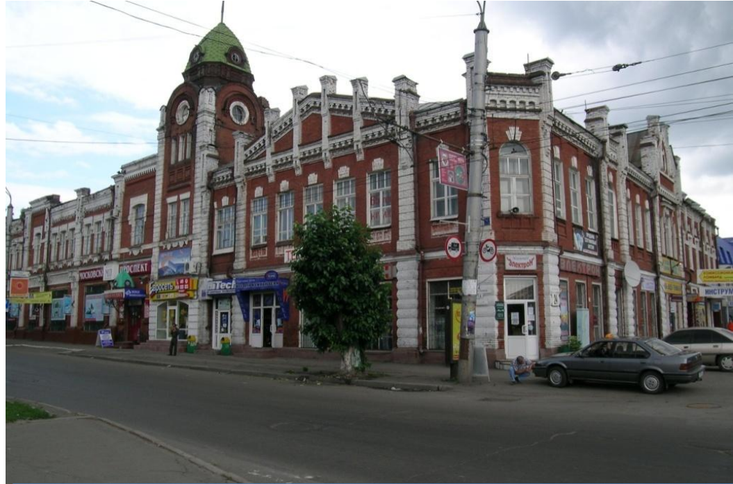
Здание Барнаульской городской думы. Арх. Носович, 1914 г.

Проведена на тех же принципах и в тех же целях, что и земская реформа.