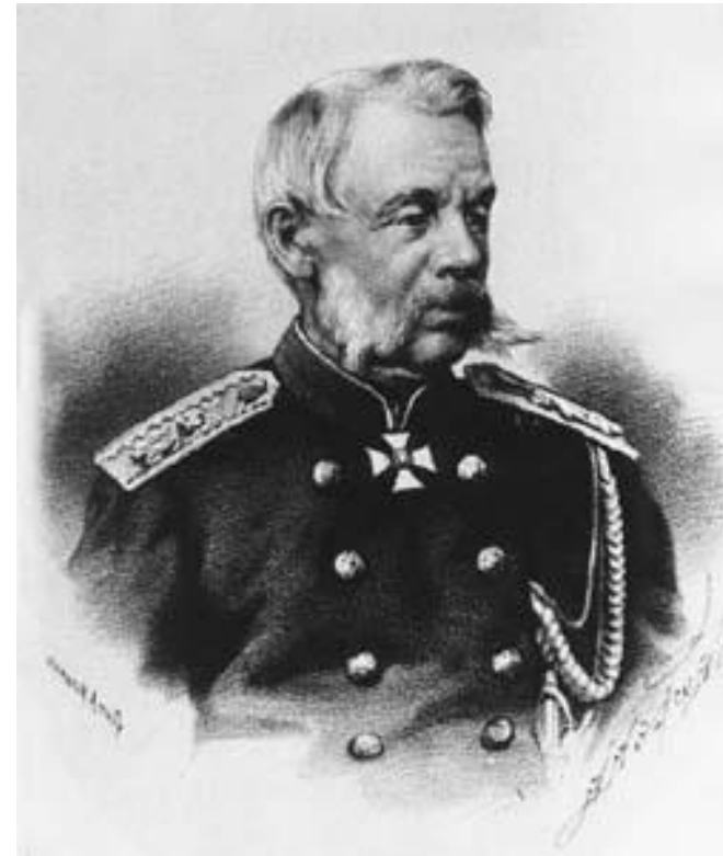
Д.А. Милютин, военный министр Александра II

Назовите сроки службы, имевшиеся отсрочки и освобождения от службы .