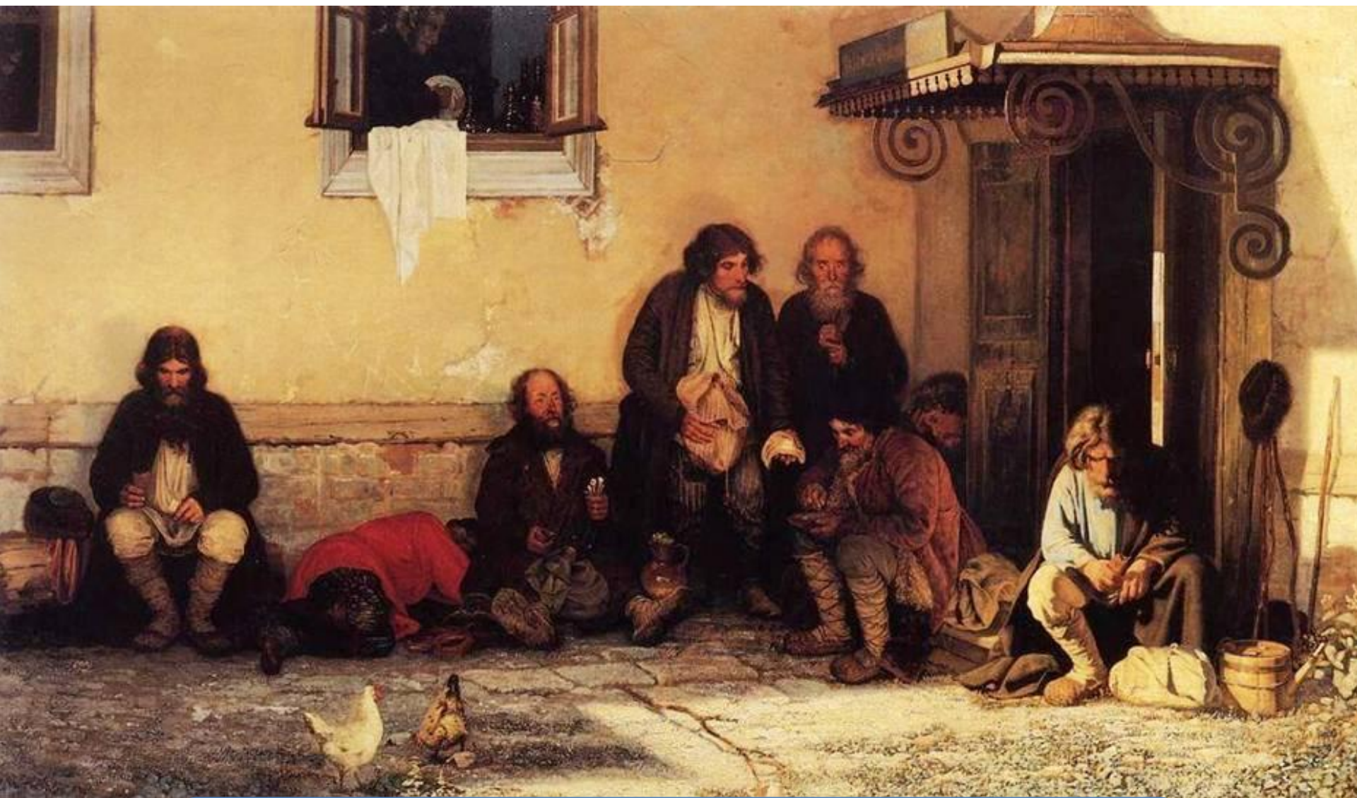
Худ. Г. Мясоедов. Земство обедает