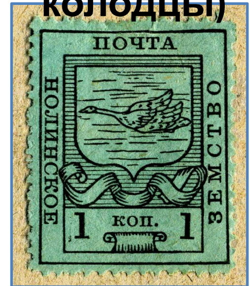
Марки земской почты в настоящее время являются большой редкостью!

Инфраструктура (Дороги, мосты, земская почта, колодцы)