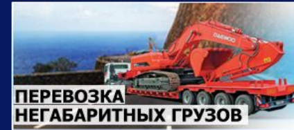
ПЕРЕВОЗКА НЕГАБАРИТНЫХ ГРУЗОВ