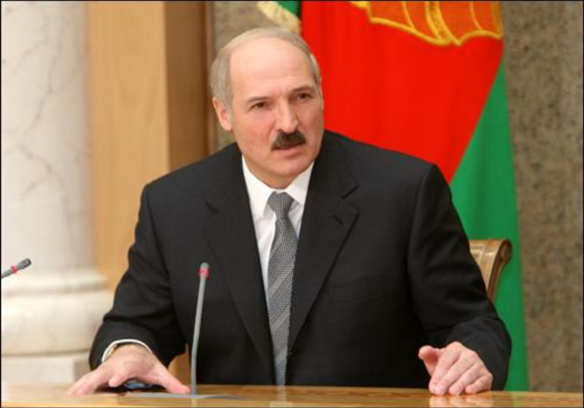
Президент Республики – Александр Лукашенко