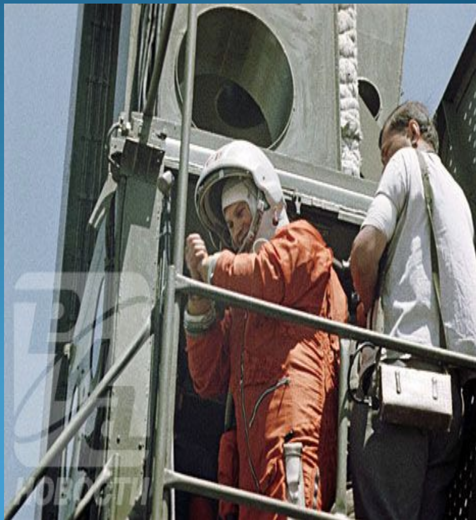
Валентина Терешкова перед стартом

Ее первый полет состоялся 16 июня 1963 года на корабле Восток-6. На околоземной орбите она находилась 2 дня и 23 часа, проделав сорок восемь оборотов вокруг нашей планеты. На время полета у Валентины был позывной "Чайка".