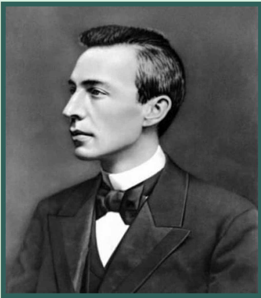
Сергей Васильевич РАХМАНИНОВ (1873-1943 г.г.)