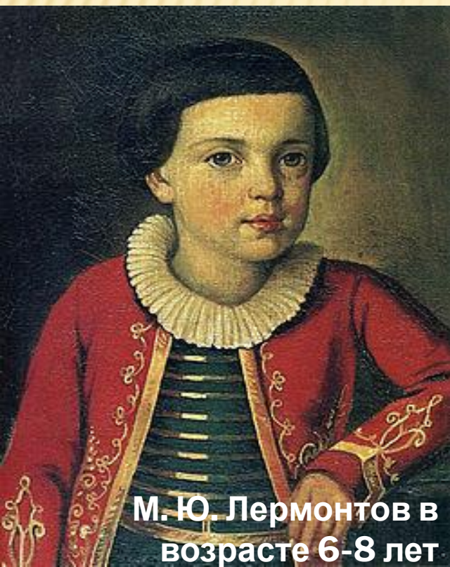
М. Ю. Лермонтов в возрасте 6-8 лет