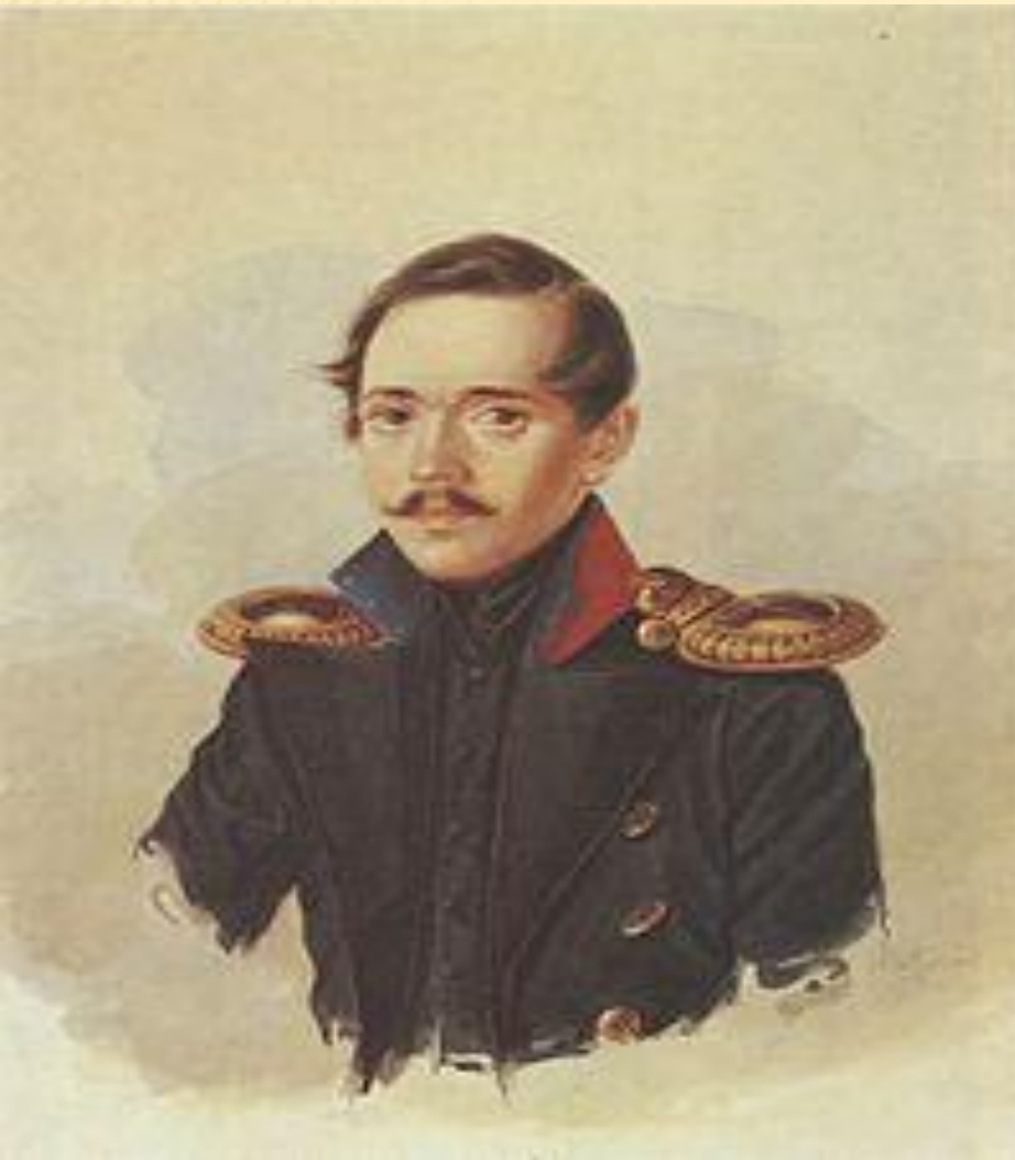
М. Ю. Лермонтов после возвращения из первой ссылки. 1838 год