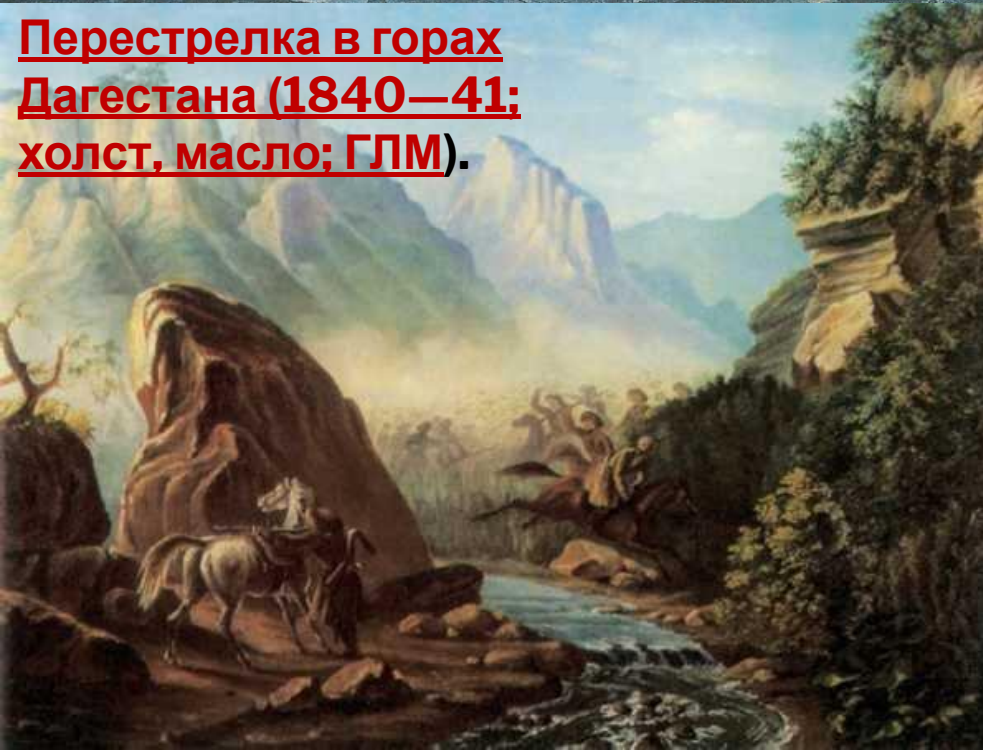
Перестрелка в горах Дагестана (1840—41; холст, масло; ГЛМ).