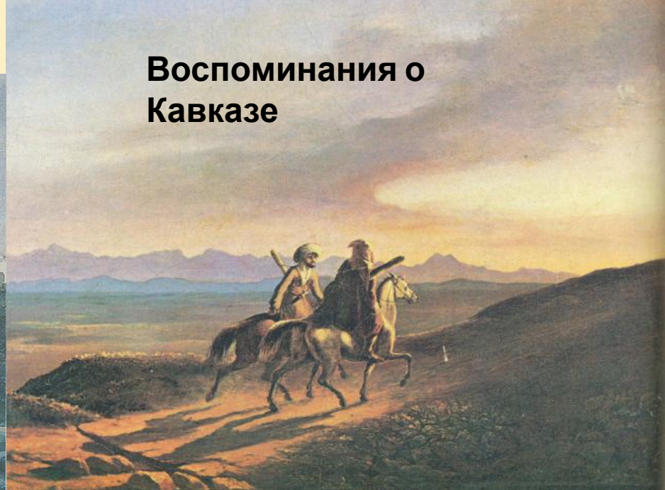
Воспоминания о Кавказе