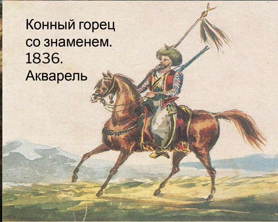
Конный горец со знаменем. 1836. Акварель