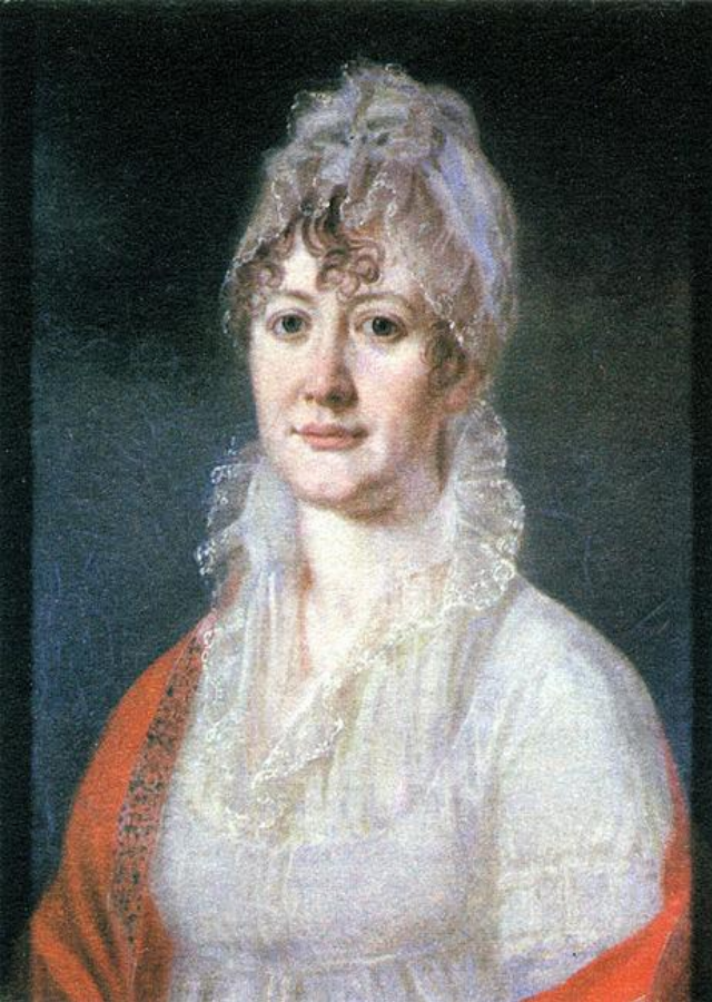
Арсеньева Елизавета Алексеевна. (1773-1845гг.) бабушка великого русского поэта М.Ю. Лермонтова.