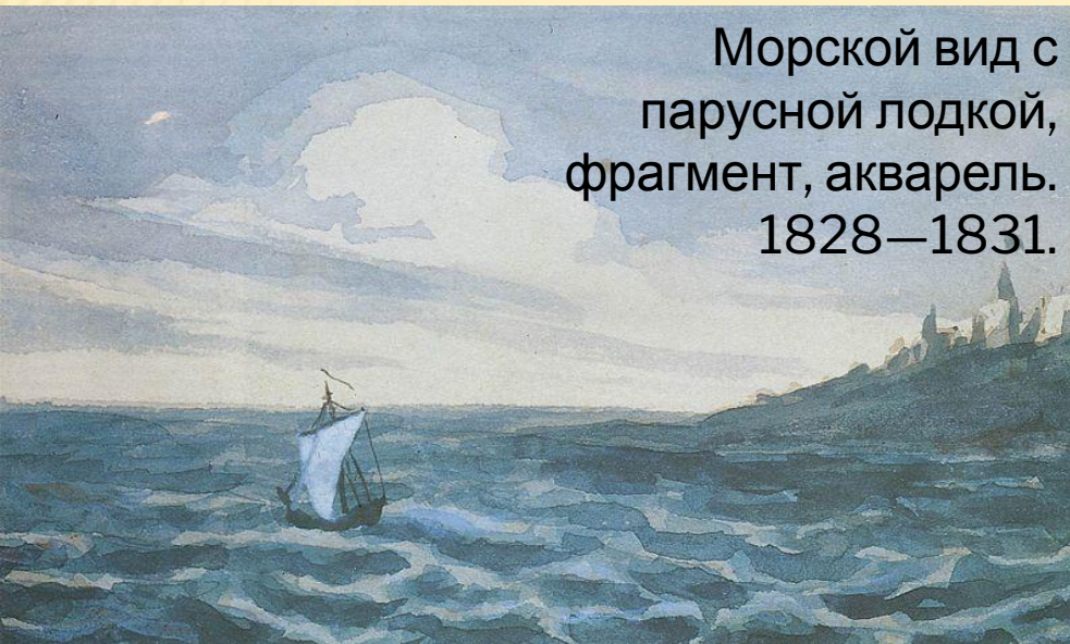
Морской вид с парусной лодкой, фрагмент, акварель. 1828—1831.