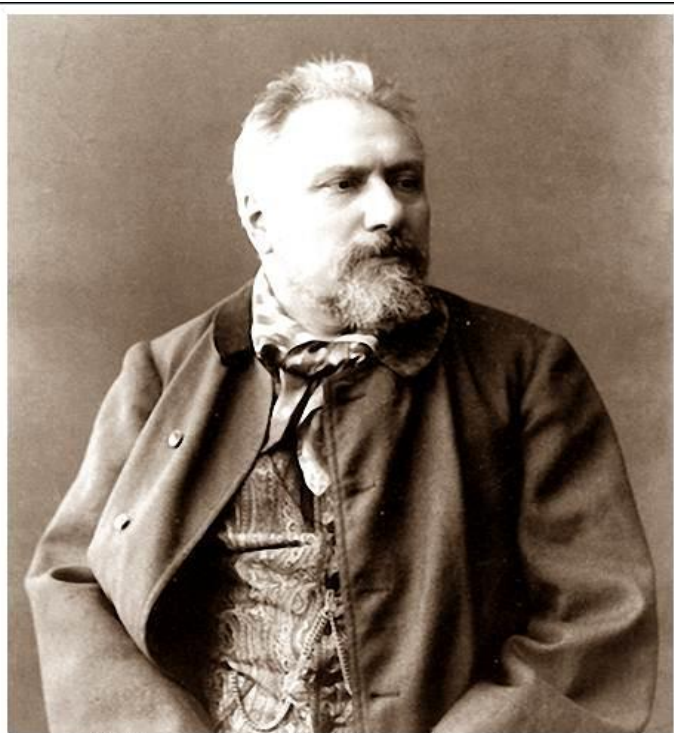
Николай Семёнович Лесков