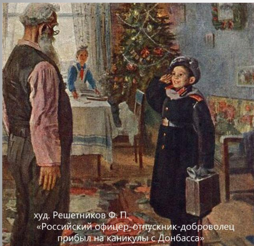
худ. Решетников Ф. П. «Российский офицер-отпускник-доброволец прибыл на каникулы с Донбасса»