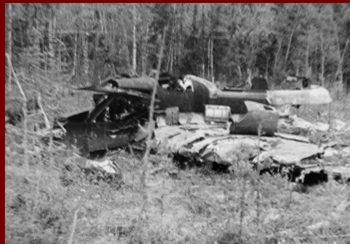
Остатки Ил-2, найденные в Карелии (6)