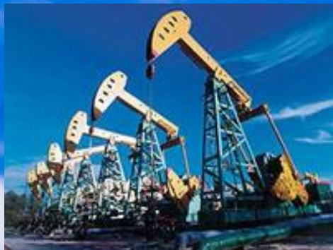
добыча нефти и газа