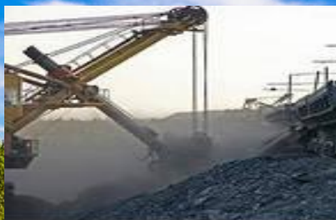
добыча каменного угля