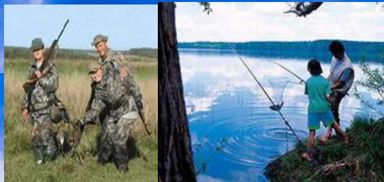
охота и рыбалка