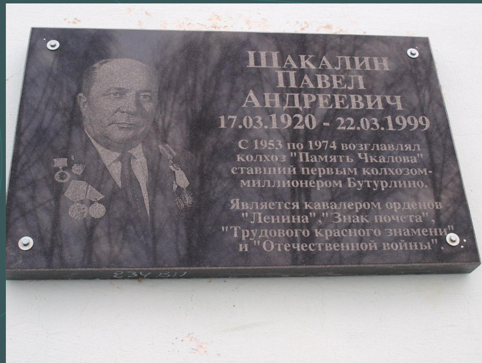
мемориальная доска, которая находится на стене СДК с. Кочуново