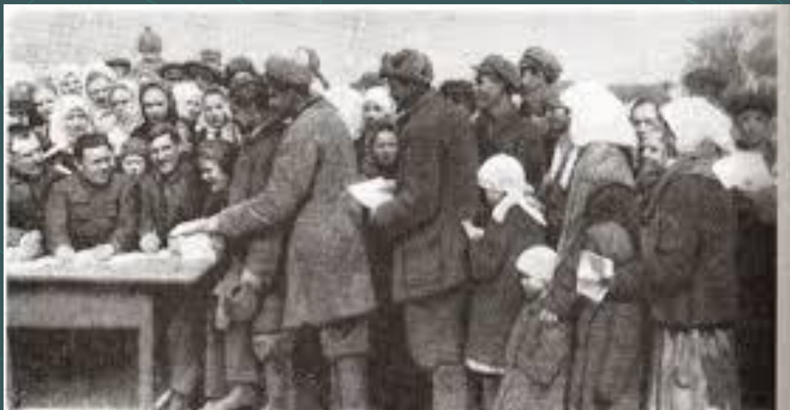
Подача прастыянамі заявак о прыняцці в колхоз, Борысоголебнай раён Цэнтральнай чэрвокалмейскай абласці. 1929 г. Фота