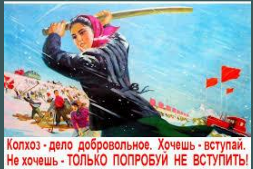
плакаты того времени