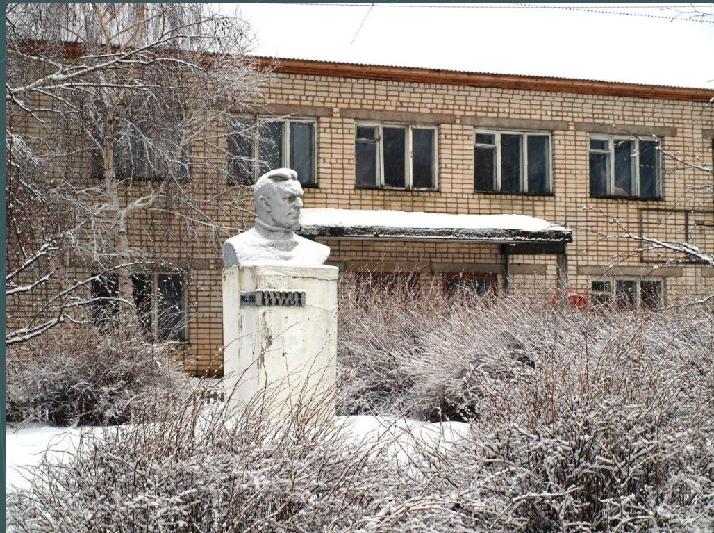
Старое здание правления колхоза и бюст Валерию Чкалову

Практическая значимость работы определяется возможностью её использования в исследованиях краеведческого характера.