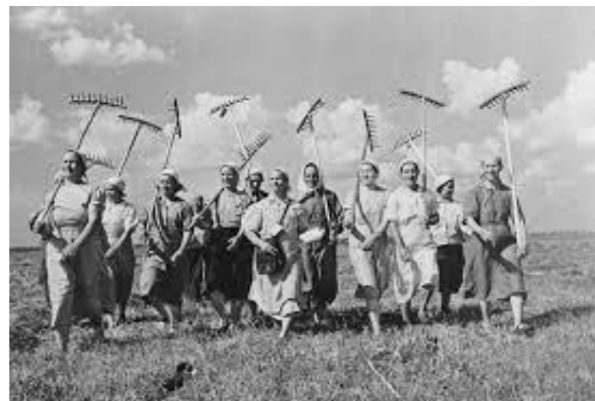
колхозная бригада на уборке хлеба