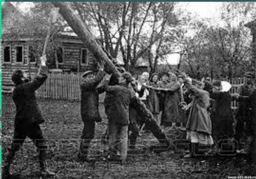
Электроопоры ставили всем миром