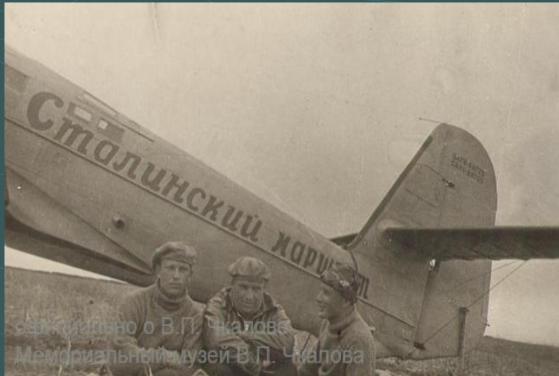
связано о В.П. Чкалове Мемориальный музей В.П. Чкалова

Всем колхозам, заводам и предприятиям давались яркие социалистические «имена». Нашему колхозу было присвоено название «Память Чкалова». Валерий Чкалов – это наш земляк, нижегородец. Два дальних беспосадочных перелета, совершенных под его командованием, навсегда вошли в историю отечественной и мировой авиации.