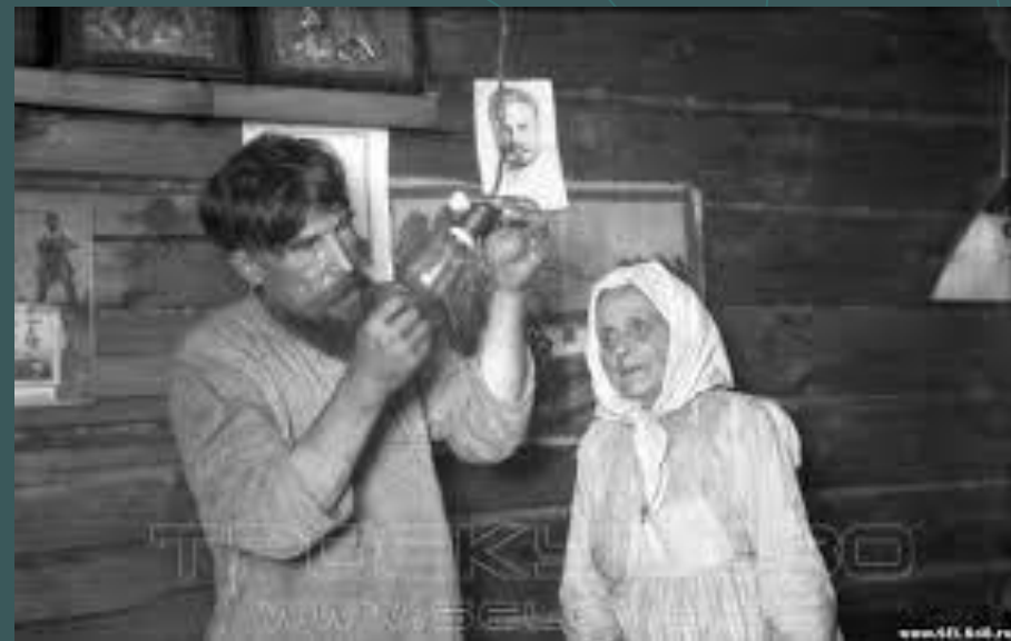
Лампочку считали чудом