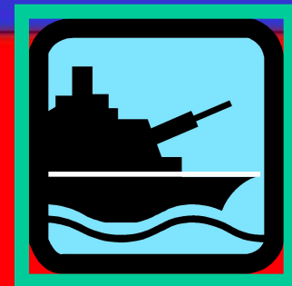
Поражение в русско- японской войне