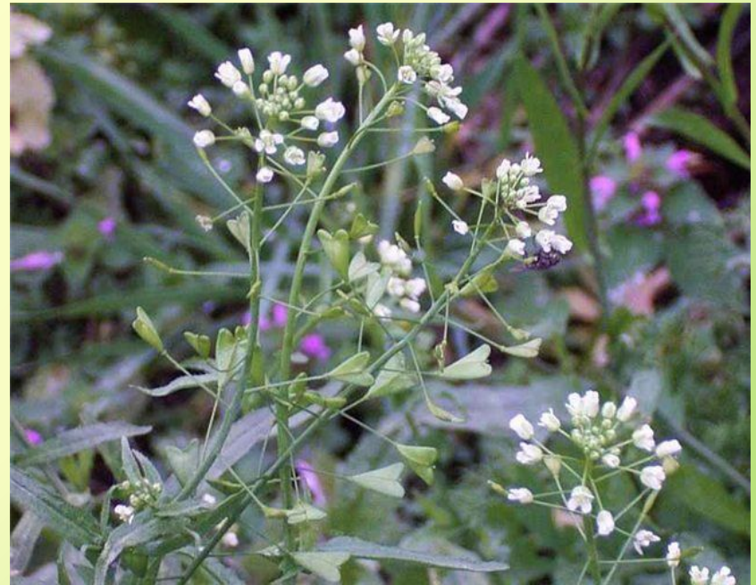
ПАСТУШЬЯ СУМКА ТЫСЯЧЕЛИСТНИК