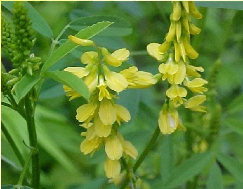
МЫШИНЫЙ ДОННИК ГОРОШЕК