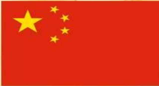
Флаг Китайской Народной Республики

Китай (официальное название — Китайская Народная Республика) — социалистическое (коммунистическое) государство в Восточной Азии.