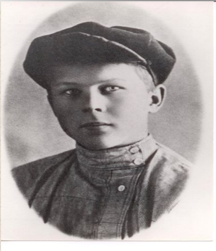
Первая фотография А. Твардовского, появившаяся в смоленской газете «Юный товарищ» 27 апреля 1927г.