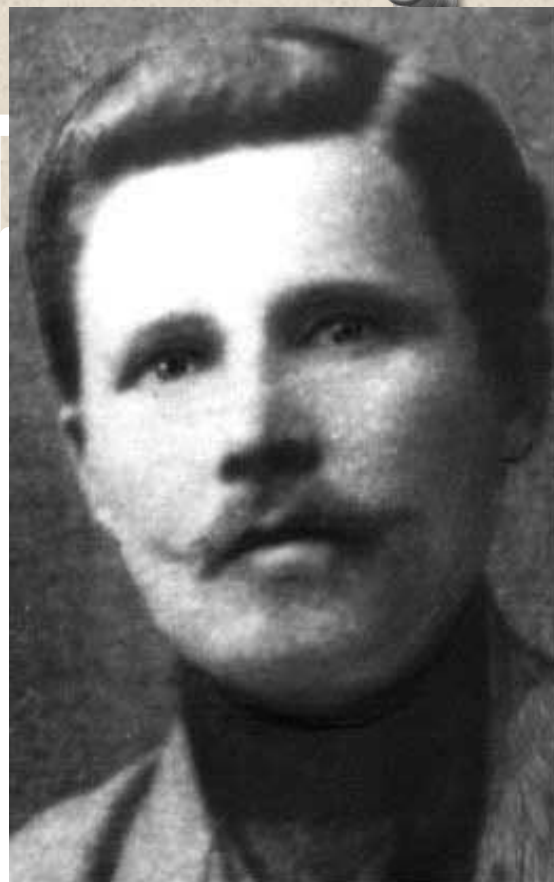
Отец А. Т. Твардовского