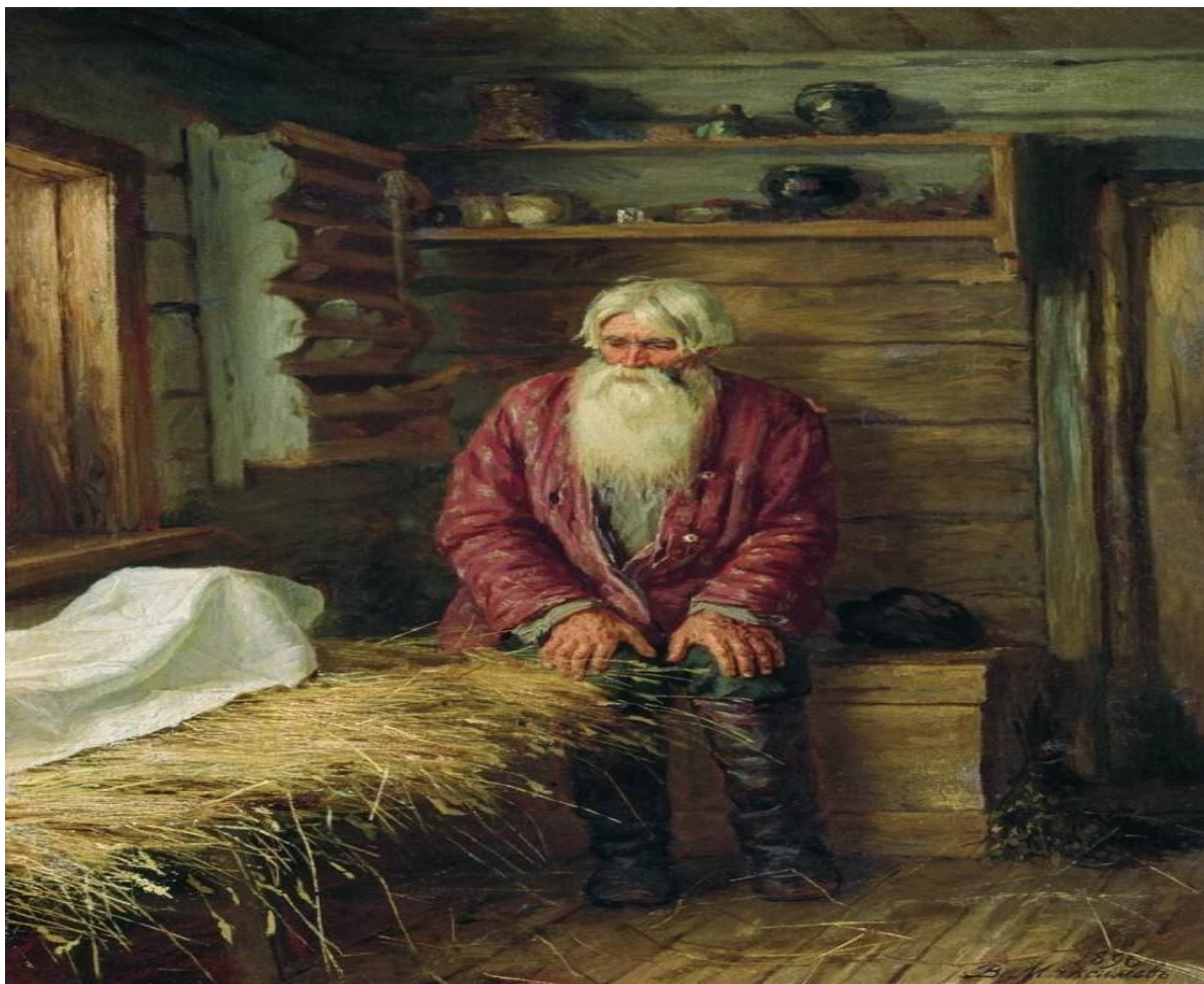
Максимов В. Пережил старуху. 1896