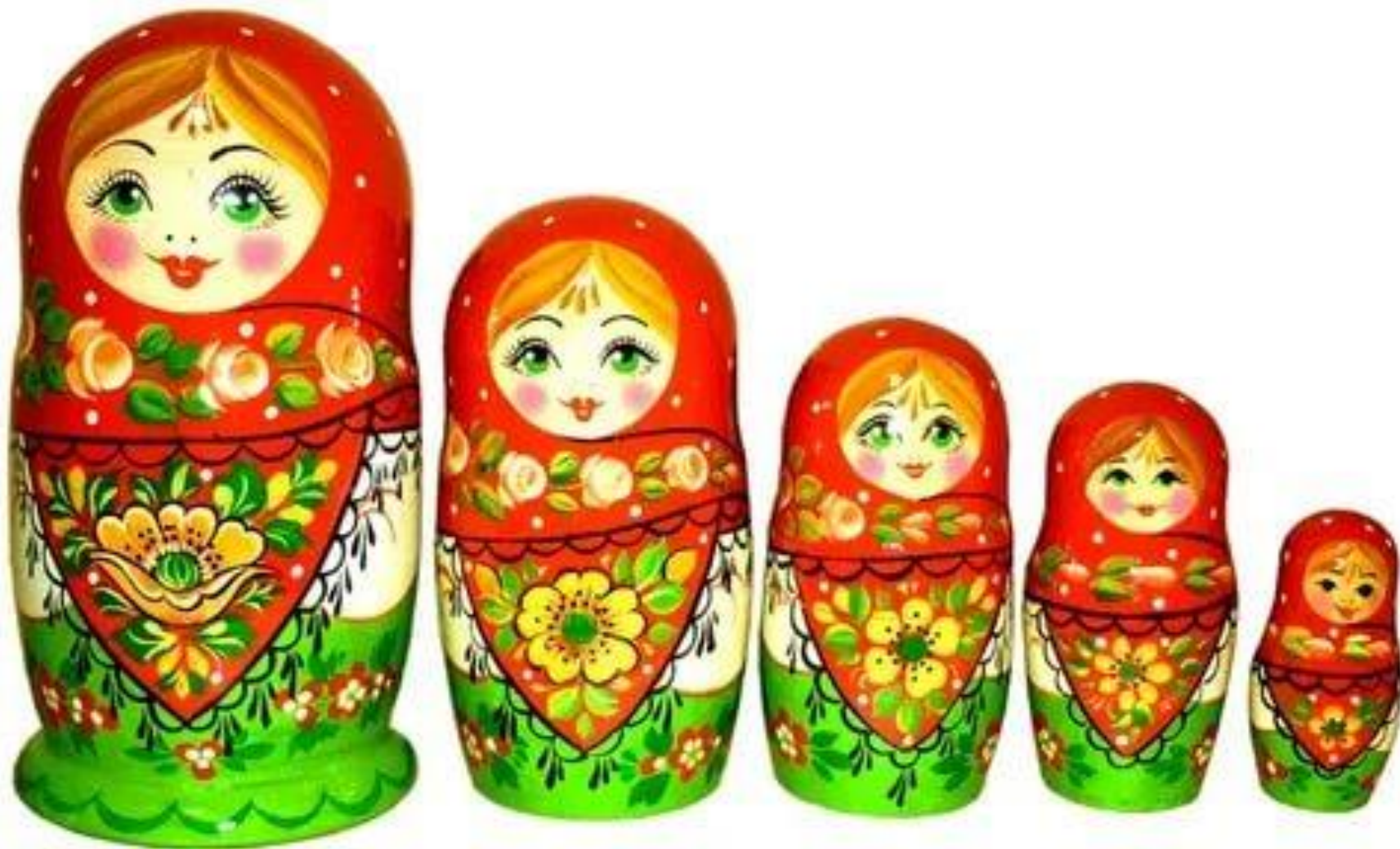
Матрёшка / матрёшки