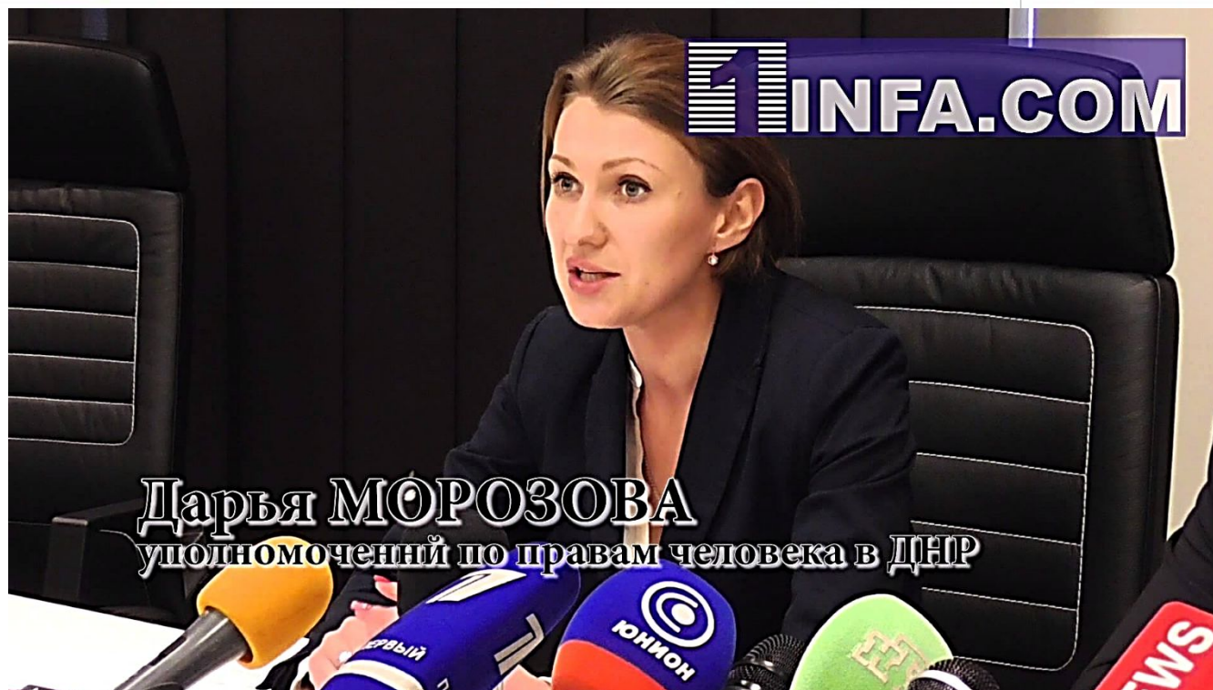
Дарья МОРОЗОВА уполномоченный по правам человека в ДНР