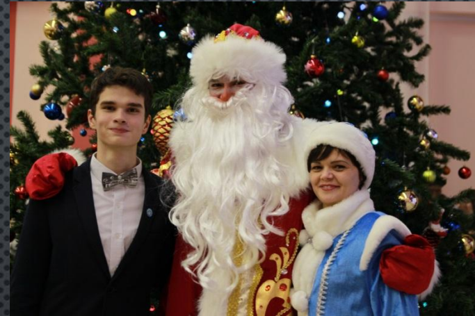
Организатор и ведущий Городского бала РДШ