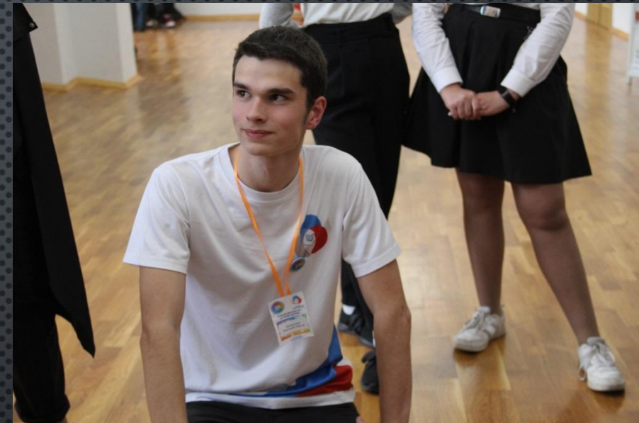
Присвоение звания “Инструктор” по итогам года, дважды подряд