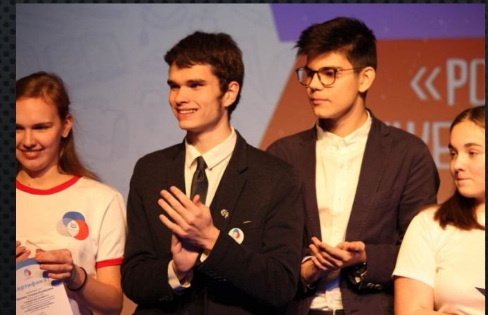
Член Городского штаба Российского движения школьников по направлению “Гражданская активность”