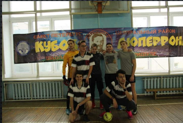
Большой фанат футбола