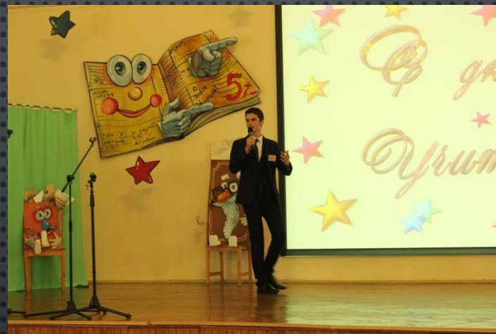
День самоуправления на День учителя (организатор)

I Открытый гимназический кинофестиваль “Время” (организатор)