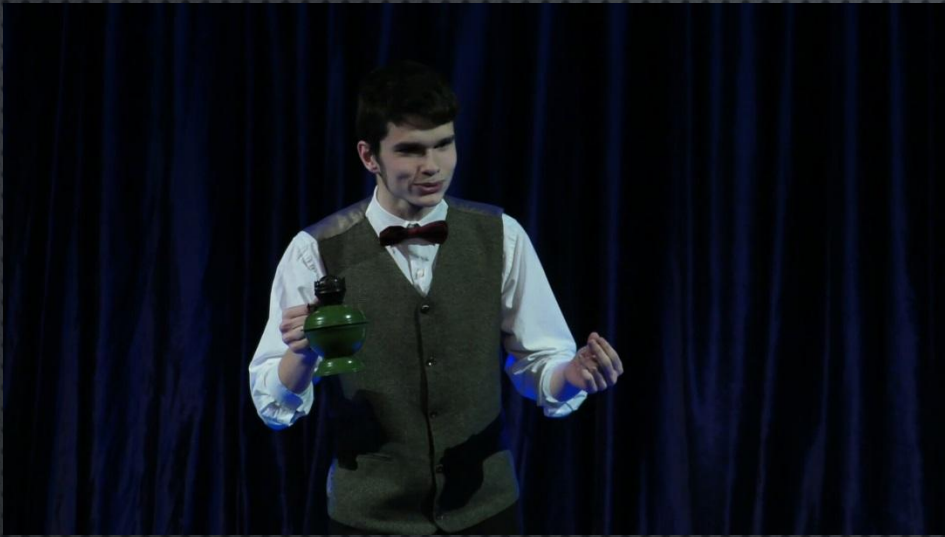
Иногда выступаю на театральной сцене