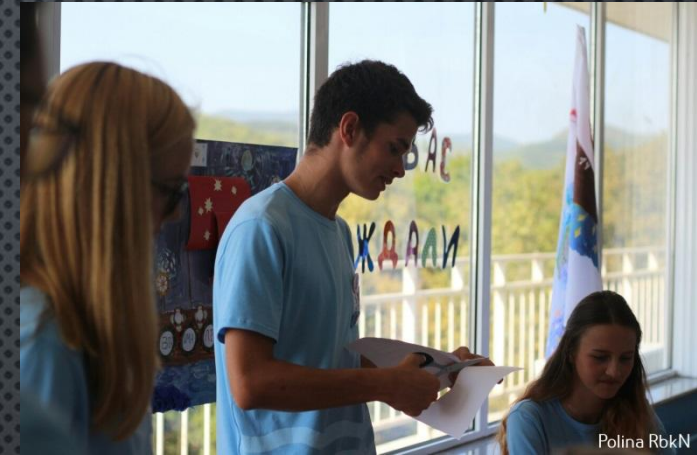
Участник Всероссийского форума РДШ в ВДЦ “Орлёнок” “Шаг в будущее страны”, обладатель звания “ШТУРМАН”