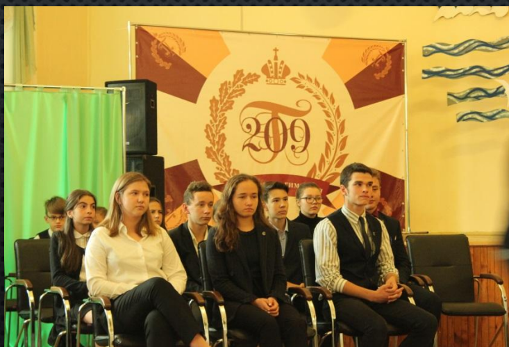
Ответственный за интересные дела