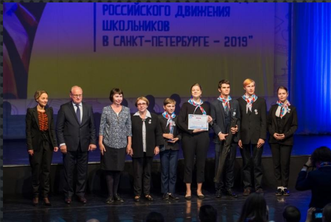
Член “Лучшей команды РДШ” в Санкт-Петербурге 2019 года