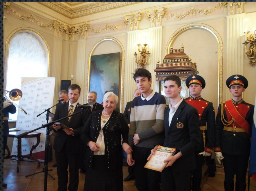
Лидер и соорганизатор школьного “Исторического клуба”