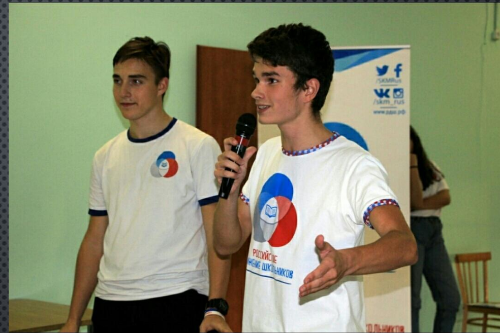
Представитель гимназии в городе и районе