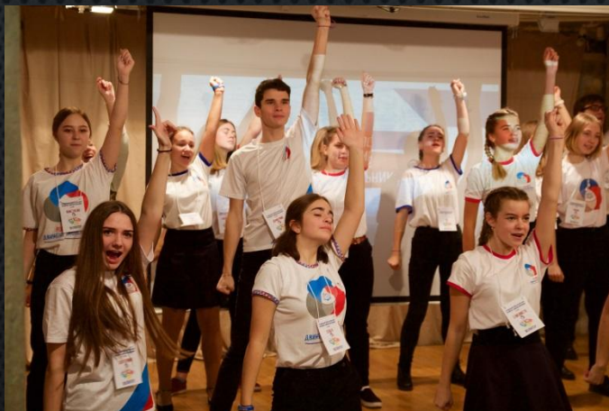
Организатор I Регионального Родительского форума