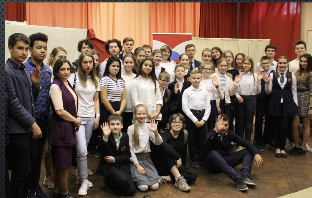
Ежегодный круглый стол подводящий итоги прошедшего учебного года