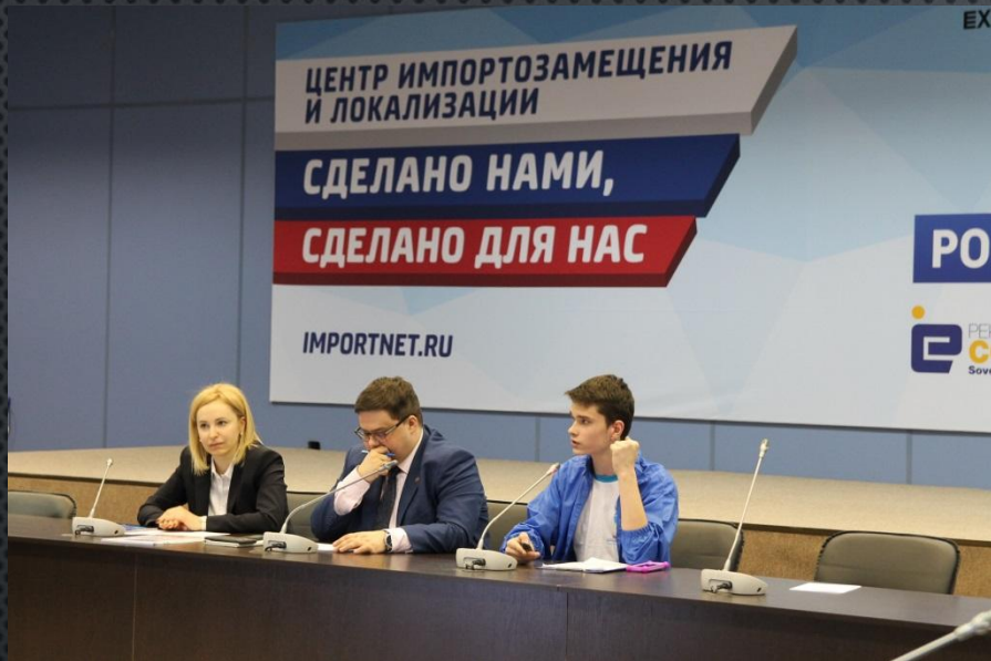
Ведущий и организатор районных слётов “В ритме Центра”