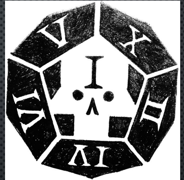
Любитель настольных ролевых игр