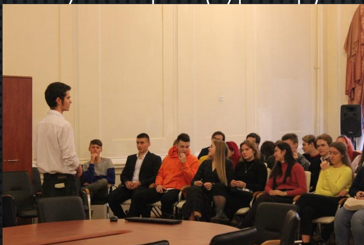
Традиционная встреча выпускников (ведущий)

Встреча поколений “Память – в наследство” (ведущий)