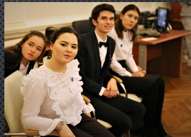
XXVIII Международные рождественские чтения

I Открытый гимназический кинофестиваль “Время” (организатор)