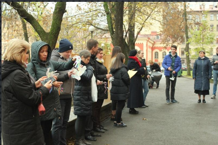
Миротворческая акция “Голубь мира” (куратор)