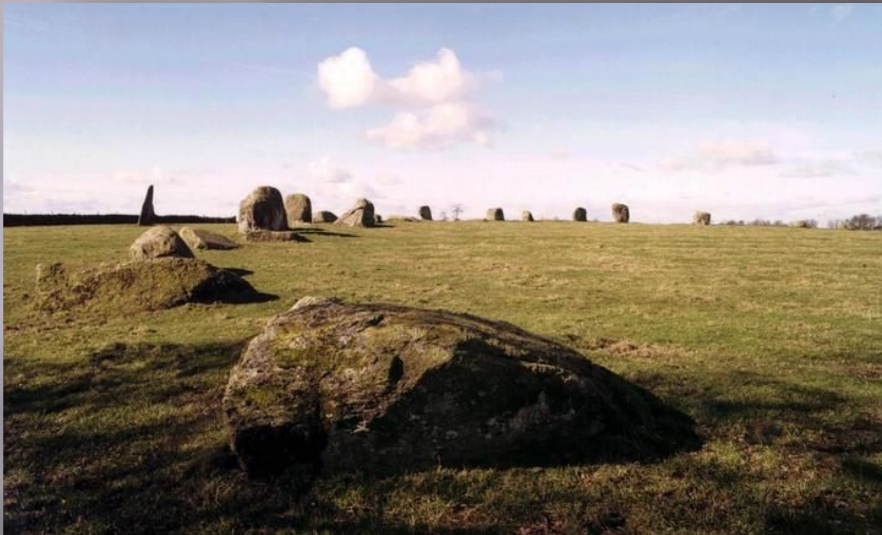
Южная дуга круга и монолит, вид с востока