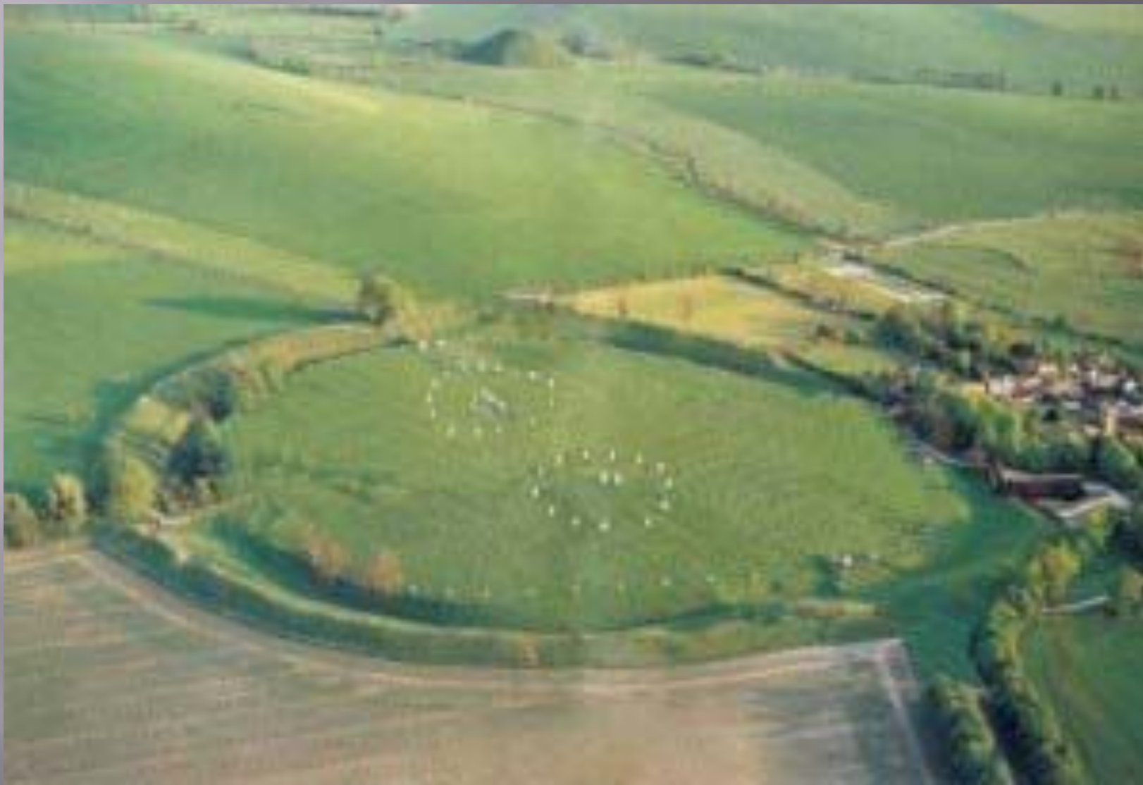
Каменный аллеи и святилище