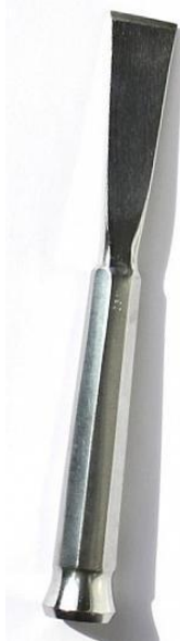
Долото для отделения мышц