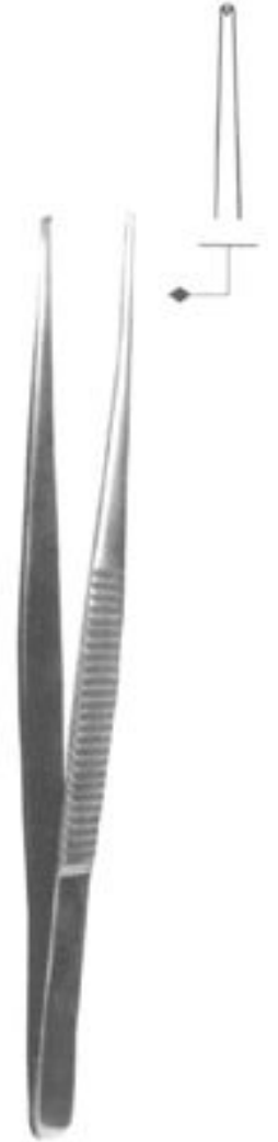
Пинцет для захвата твёрдой мозговой оболочки