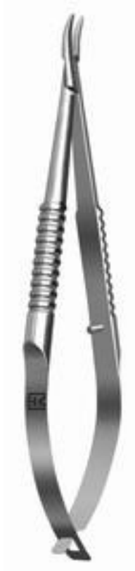
иглодержатель микрохирургический Якобсона