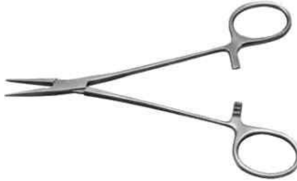
зажим типа Москит