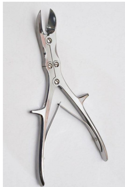
Щипцы Листона с двойной передачей