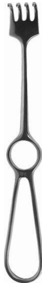
Крючок 4-х зубый тупоконечный