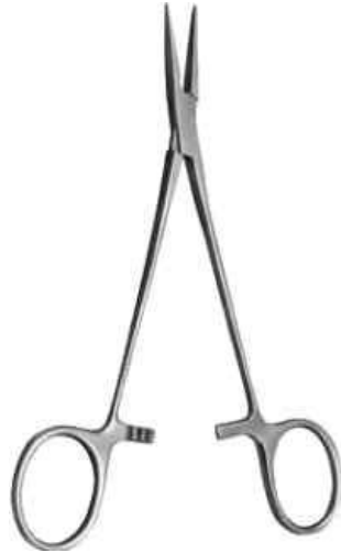
Зажим типа «МОСКИТ» прямой