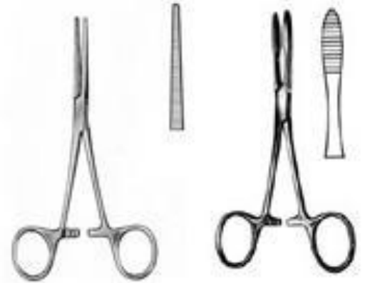
зажим типа Госс