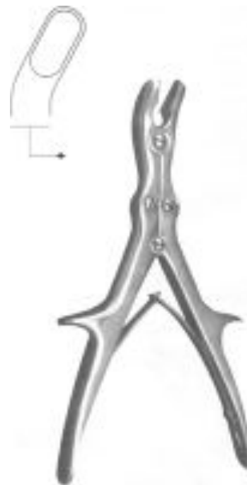
Кусачки Люэра с двойной передачей