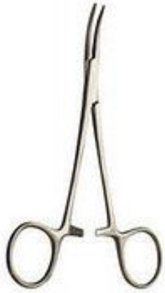
Зажим типа «МОСКИТ» изогнутый