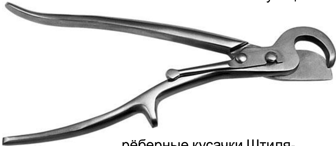
рёберные кусачки Штиля- Гирцг