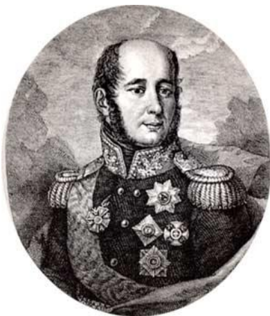
Барклай де Толли