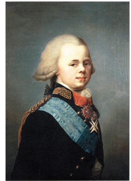
Неизвестный художник. Портрет великого князя Константина Павловича, шефа Измайловского полка. 1795 год. ГРМ.