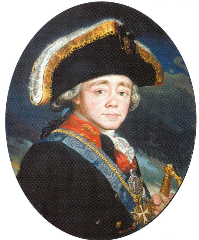
Император Павел I (1796–1801).

6 ноября 1796 года Екатерина II скончалась от апоплексического удара. Императором стал ее сын Павел I Петрович (1796 – 1801 гг.).