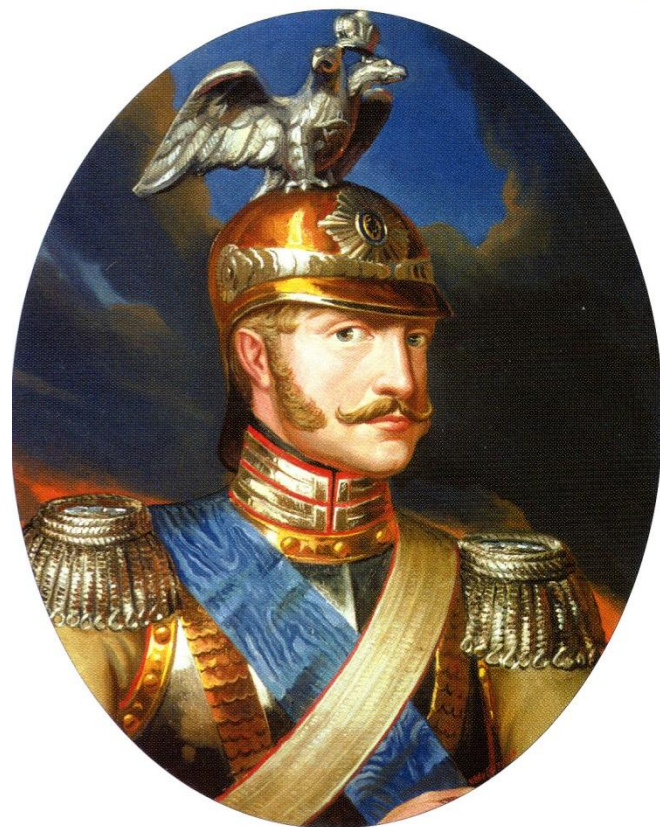
Император Николай I (1825–1855).

Возросла роль Собственной его императорского величества канцелярии. Она превратилась в важный орган власти. Созданные, в ее составе 6 отделений, представляли собой самостоятельные высшие государственные учреждения со своими начальниками, ответственными только перед императором.