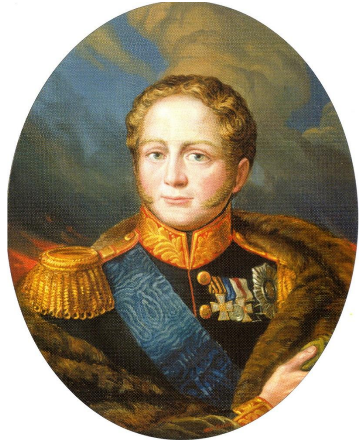
Император Александр I Благословенный (1801–1825).