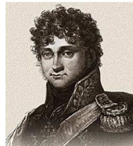
Строганов Павел Александрович