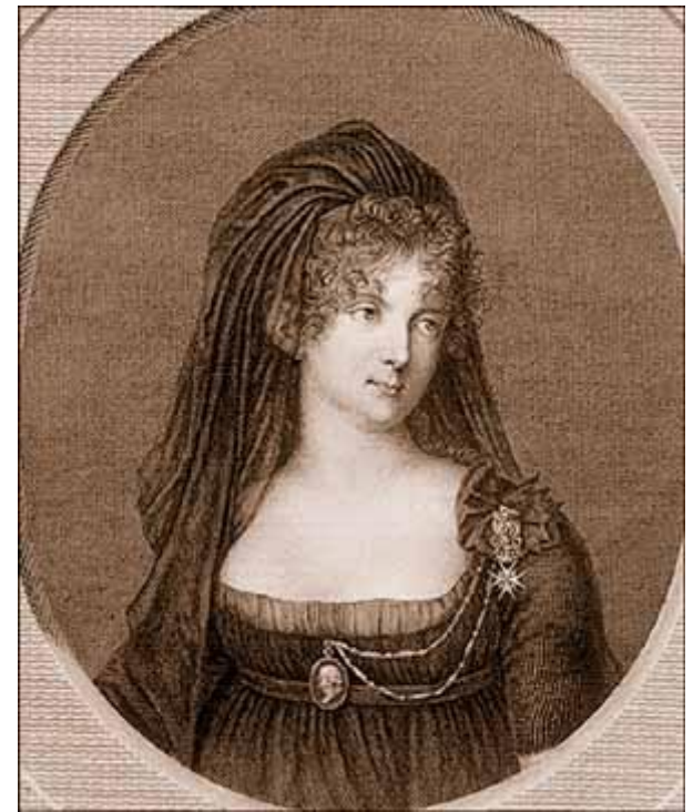
Мария Федоровна София-Доротея-Августа-Луиза Вюртембергская Супруга Павла I