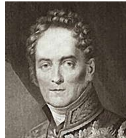
Кочубей Виктор Павлович