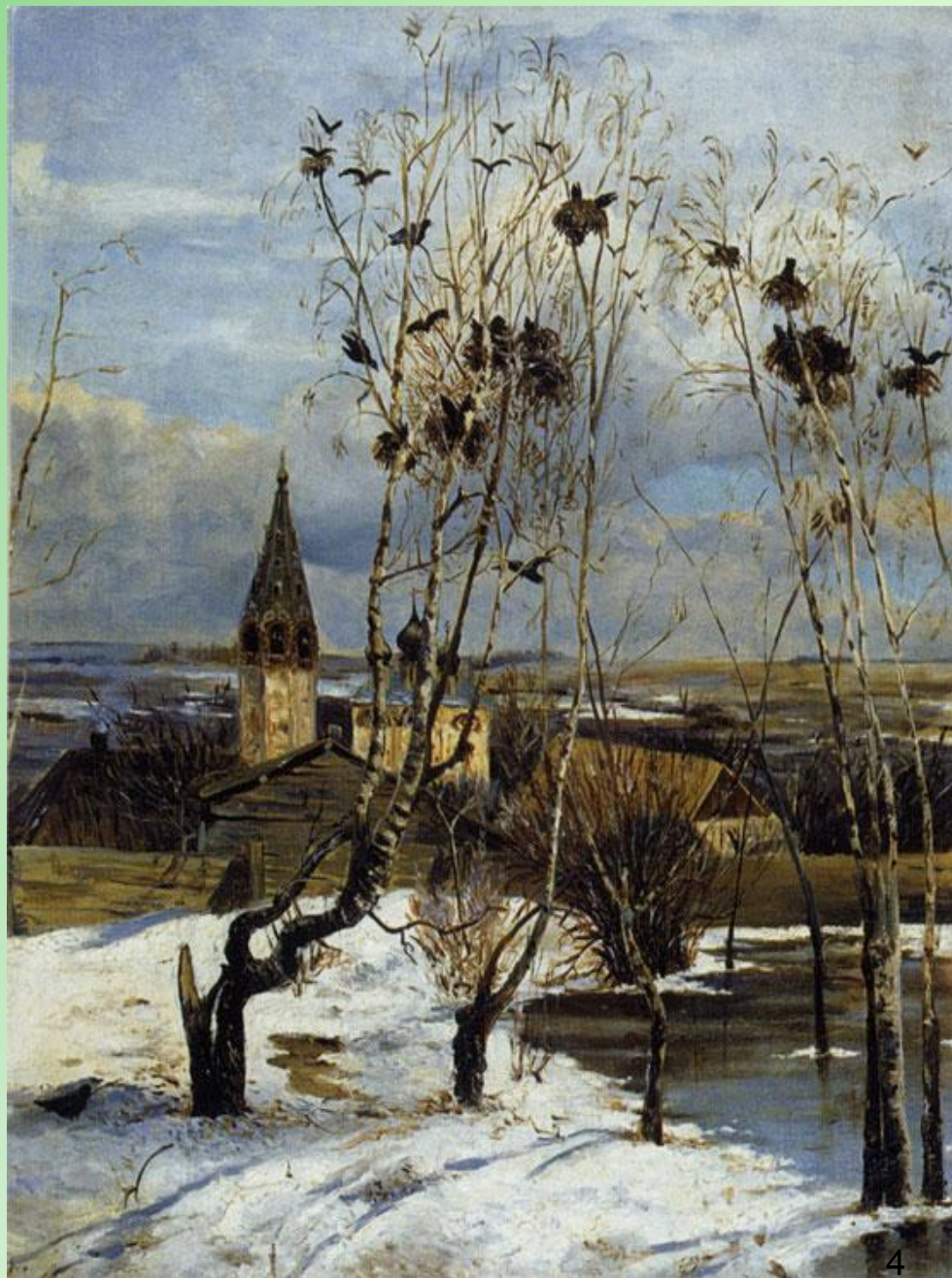
А.К. Саврасов «Грачи прилетели»