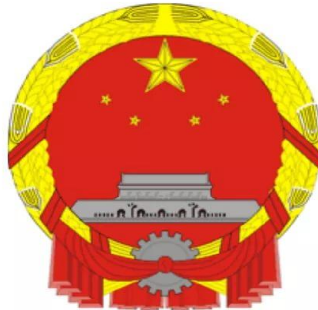
Флаг и герб Китая