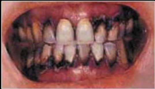
УЛЫБКА КУРИЛЬЩИКА ОНА ПРОСТО СНОГШИБАТЕЛЬНА