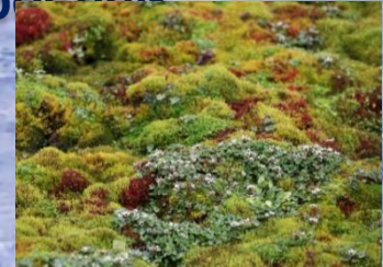
Мхи и лишайники