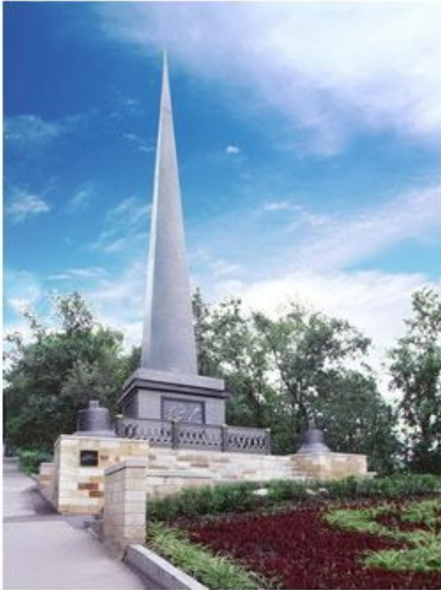
Памятный обелиск Петру I