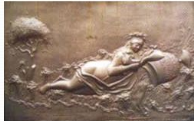
На барельефах памятника отражена история Липецка.