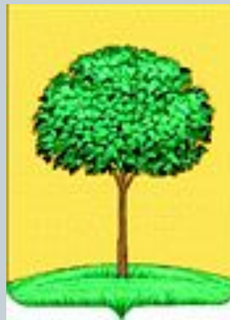
Настоящий герб Липецка