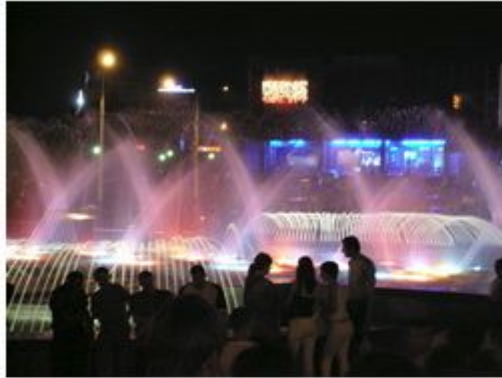
Свето - музыкальный фонтан на площади Петра Великого