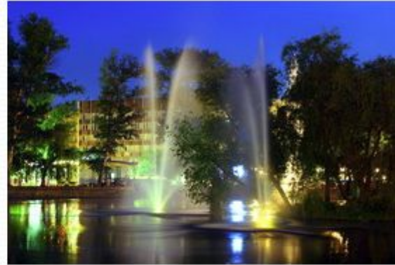
Фонтан Комсомольского пруда. Площадь революции