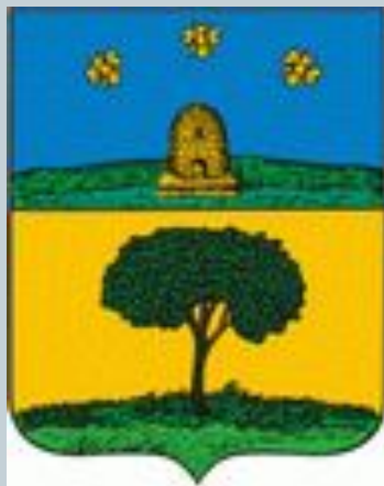
Старый герб Липецка

нижней части геральдического щита и герба губернского города Тамбова - улей и три пчелы - в верхней части