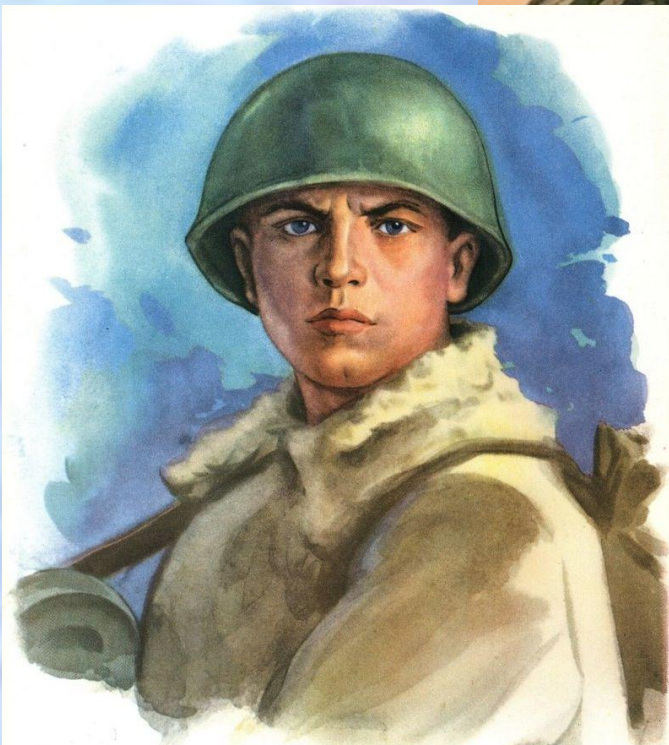
Герой Советского Союза МАТРОСОВ Александр Матросович (1924 – 1943)

23 февраля 1943 г. на одном из участков фронта у деревни Чернушки, севернее г. Великие Луки, разгорелась ожесточенная боя. Гитлеровцы прорвали деревню в опорный пункт обороны. Продвигаясь вперед наших бойцов мешала губительный огонь из фашистского дзота. Атаки задерживались одна за другой. В решающую минуту боя гвардии рядовой отважливый сын русского народа комсомолец Матросов прорвался к вражескому дзоту и закрыл своим телом его амбразуру. Бойцы поднялись в атаку и стремительным ударом разгромили противника. За подвиг А. М. Матросову было посмертно присвоено звание Героя Советского Союза. Гвардейскому стрелковому полку, где служил Матросов, присвоено его имя, а погибший герой навеки зачислен в списки 1-й роты этого полка. Его имя стало символом мужества и отваги, образцом преданности советской Родине.