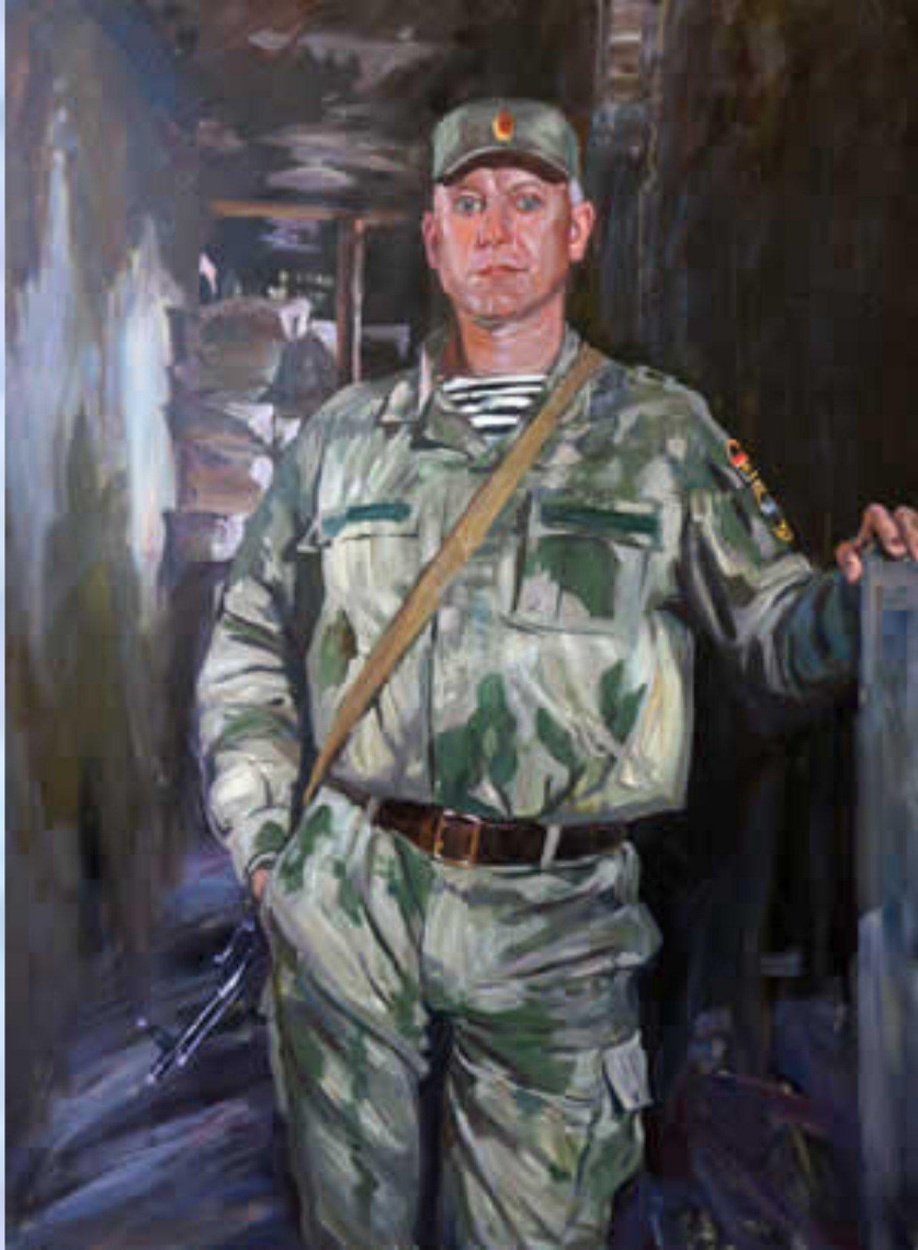
«Сварог». 2018 год холст, масло, 120x90 см