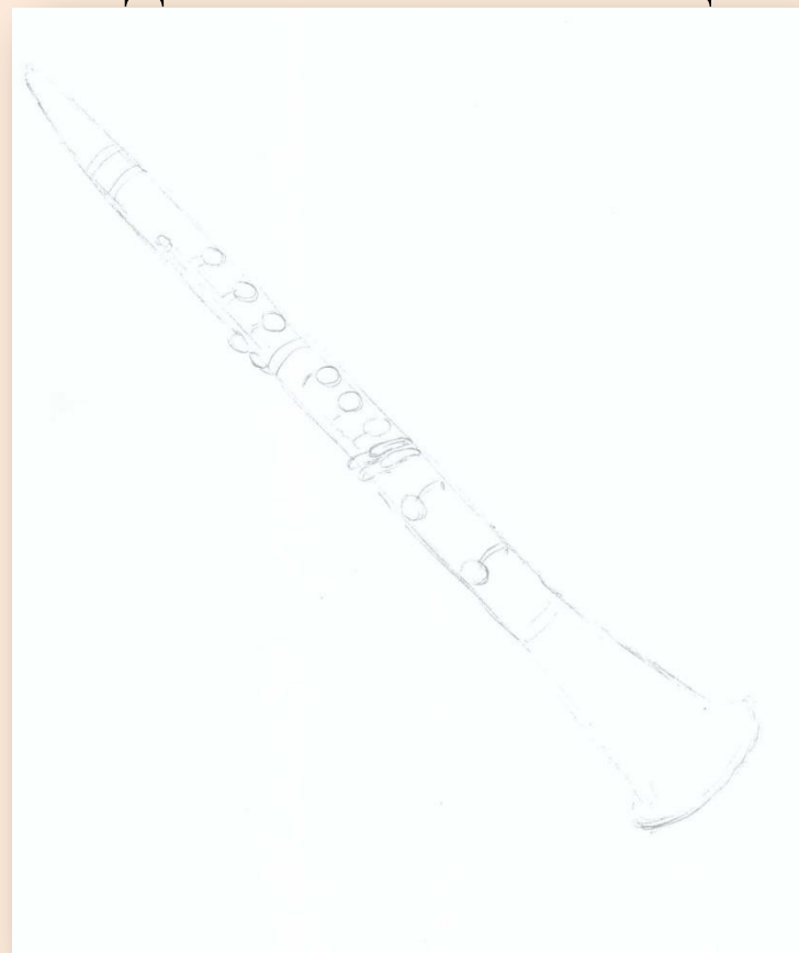
Рисунок Попович Оли

Шопен Этюд. Как будто все дети купаются в море, ныряют, плескаются. А потом солнце скрылось, и стало холодно. Все побежали к мамам и папам вытираться полотенцами. Но потом появилось солнце, и все начали играть в водные бластеры.