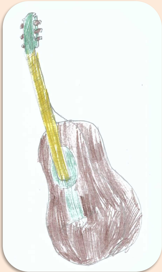
Рисунок Назимкиной Насти