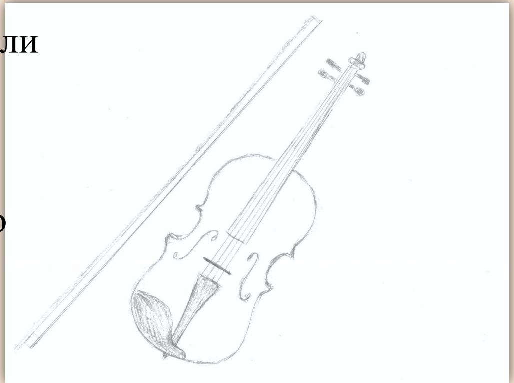
Рисунок Попович Оли

Когда же они его поймали и съели, они были счастливы. Также мне понравился Этюд Скрябина . Он как будто стремится в космос, в неизвестность.