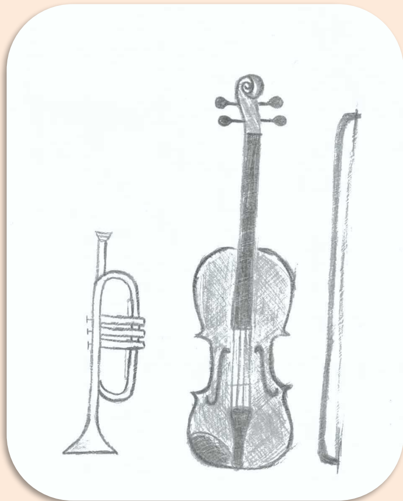
Рисунок Моногародой Даши

Мне очень понравилась музыка Шопена . В ней как будто течет ручей. Очень красиво. Очень красивая мелодия.