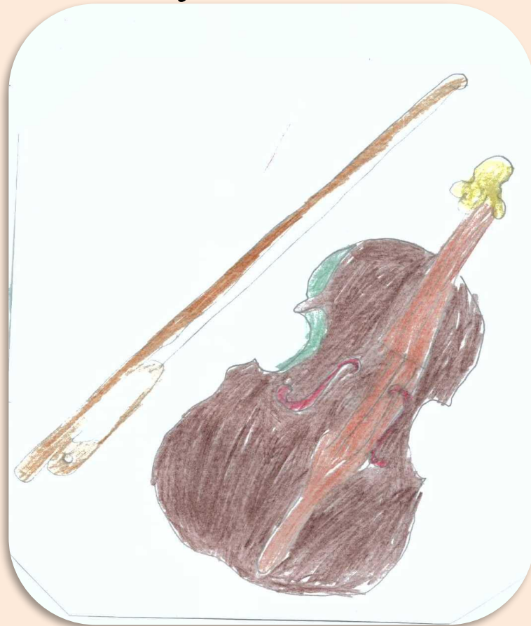
Рисунок Назимкиной Насти

Мне понравилась музыка Шопена. Она красивая. Как будто льется водопад и вокруг нас лес.