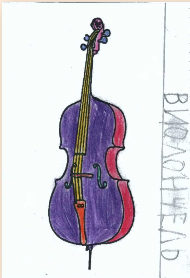
Рисунок Кондейкиной Евы