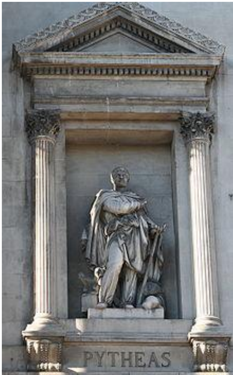
Статуя Пифея в Марселе

года до н. э. плавал вокруг Британии, а также побережья Балтийского моря.