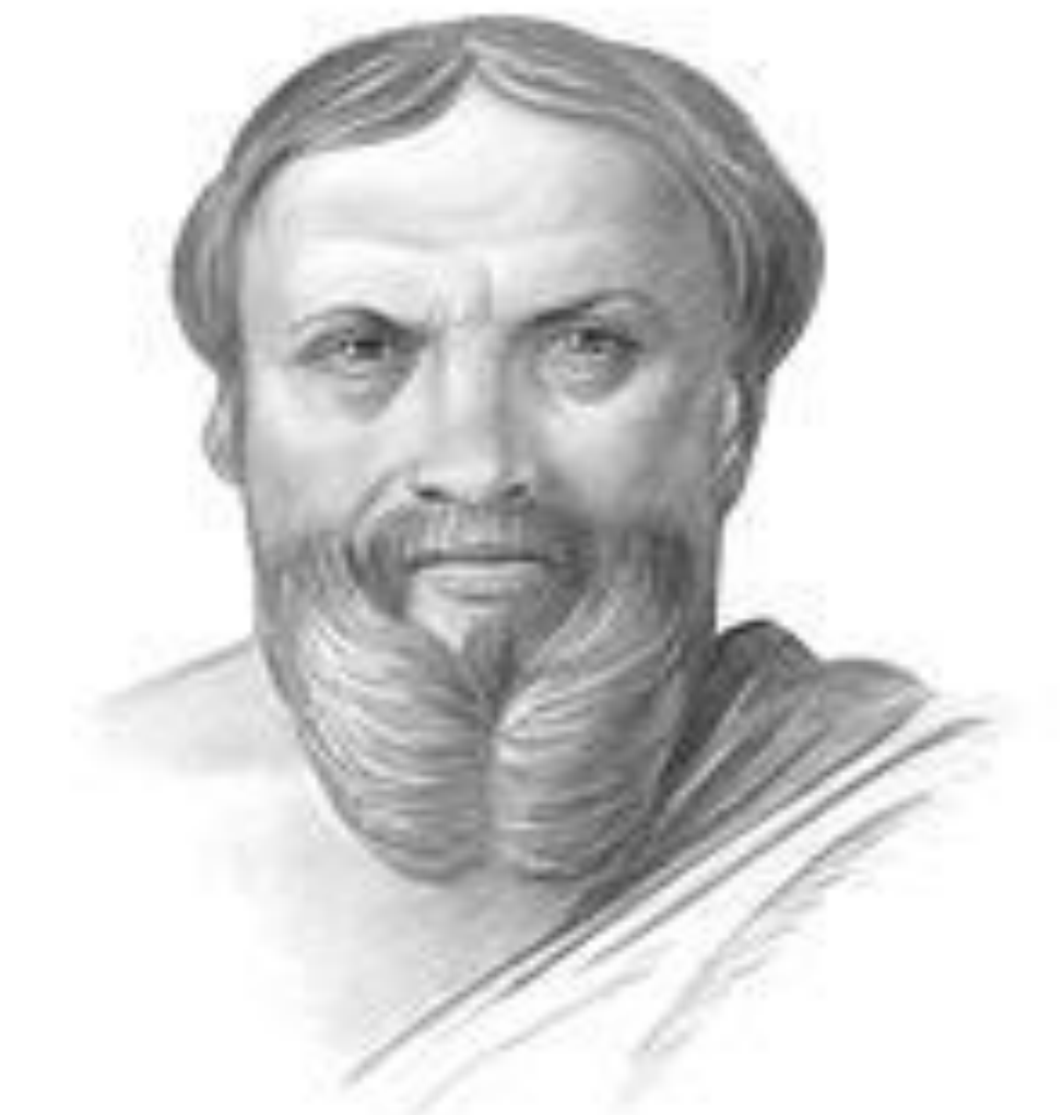
Геродот между 490 — ок. 425 г. до н. э.

В V веке до н.э. ученый грек Геродот посещает Египет, Ливию, Эфиопию, Финикию, Аравию, Вавилонию, Персию, Мидию, Колхиду, Каспийское море, Скифию и Фракию. Свои наблюдения он изложил в «Истории». Описал земли и народы, поэтому по праву Геродота называют «отцом истории и географии».