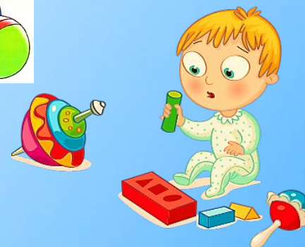
Общее развитие ребёнка