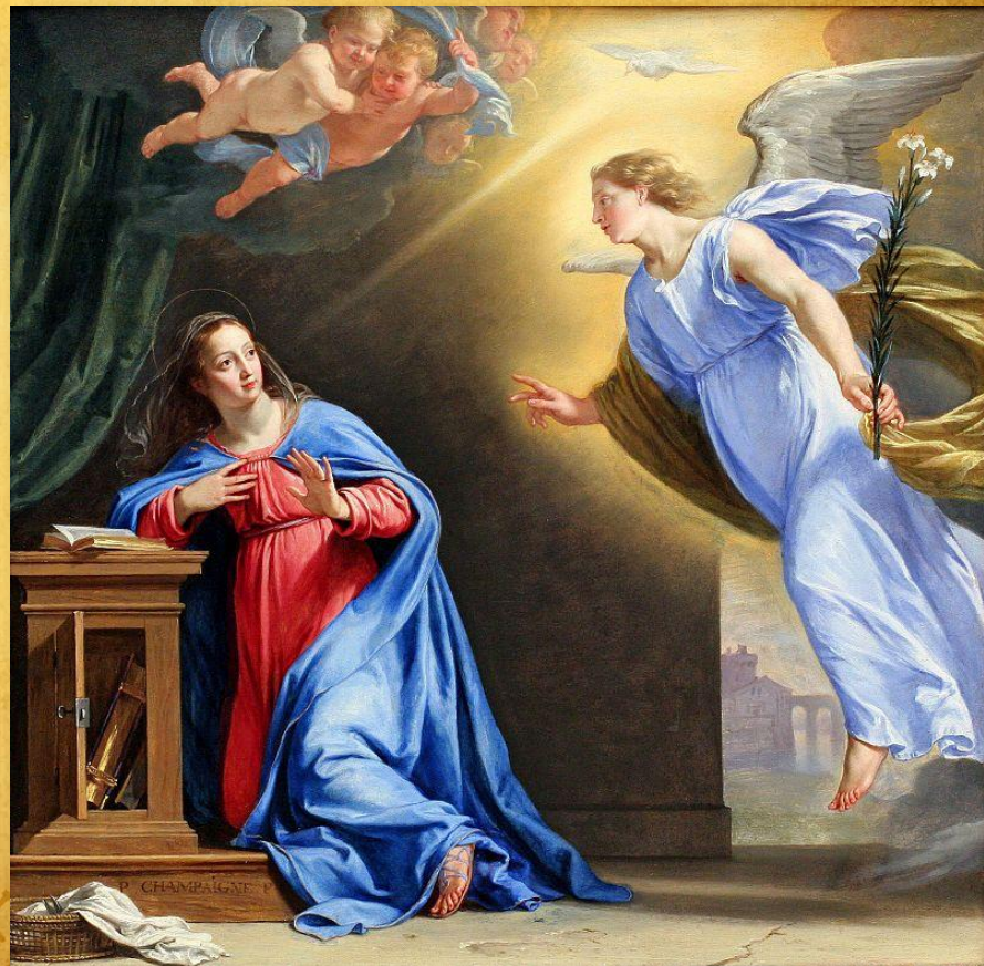
«Благая весть», 1644, худ. Филипп де Шампань

Живопись барокко, или барочная живопись, — живописные произведения периода барокко в культуре XVI—XVII веков, тогда как в политическом плане исторический период разделяется на абсолютизм и контрреформацию. Живопись барокко характеризуется динамизмом, «плоскостью» и спышностью форм, самые характерные черты барокко — броская цветистость и динамичность; яркие примеры — творчество Рубенса и Караваджо.