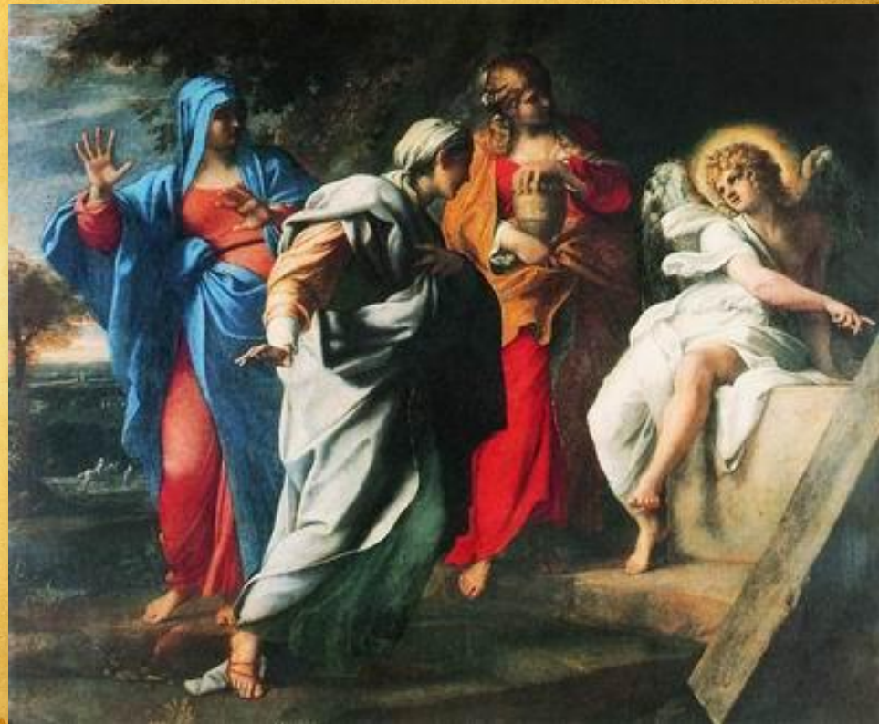
Святые жены у гроба Христа. 1597—1598 Карраччи Аннибале

Мировоззренческие основы стиля сложились, как результат потрясения, какими были в XVI в. Реформация и учение Коперника. Изменилось утвердившееся в античности представление о мире, как о разумном и постоянном единстве, а также ренессансное представление о человеке, как о разумнейшем существе. Человек стал сознавать себя «чем-то средним между всем и ничем» по выражению Паскаля, «тем, кто улавливает лишь видимость явлений, но не способен понять ни их начала, ни их конца».