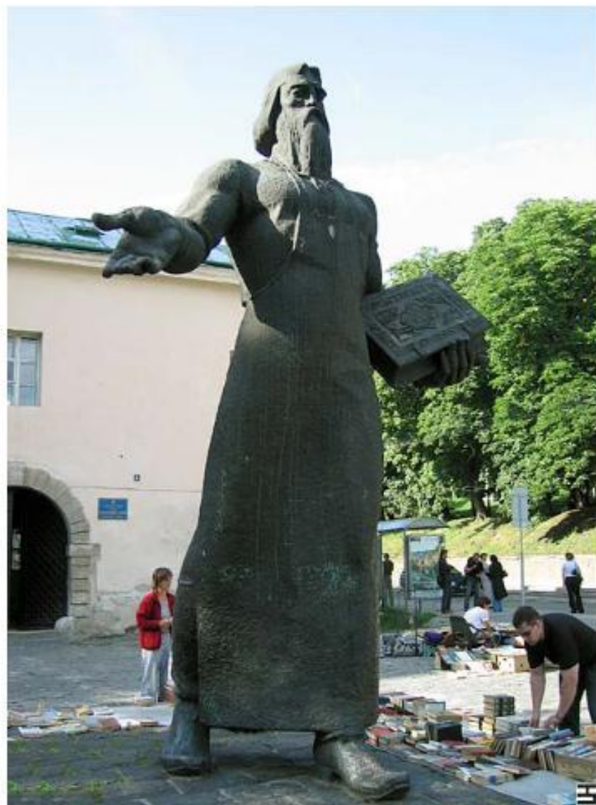
Памятник первопечатнику Ивану Федорову