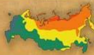
СТЕПЕНЬ БЛАГОПРИ- ЯТНОСТИ ПРИРОДНЫХ УСЛОВИЙ ЖИЗНИ НАСЕЛЕНИЯ