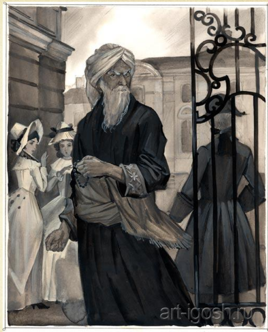
Портрет ростовщика. Иллюстрация к повести Н.В. Гоголя «Портрет»