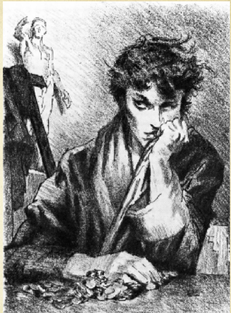
Портрёт сына художника