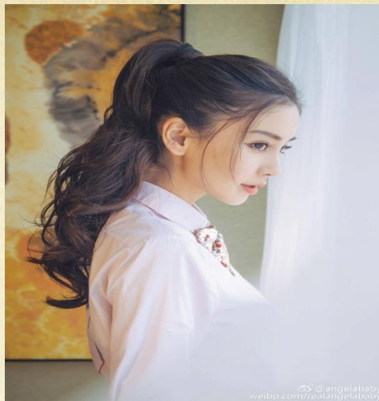
причёска с хвостом