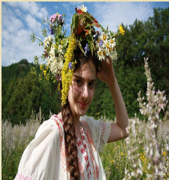
девушка с косой