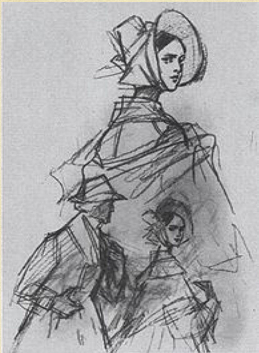
Художник В.А. Свешников, Наталья и Рудин. Иллюстрация к роману "Рудин".