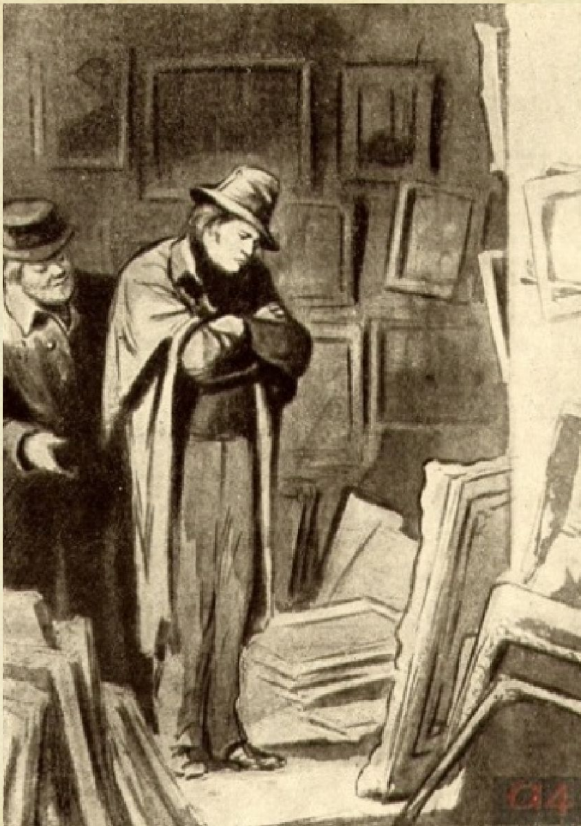
Портрет Чарткова, Кукрыниксы. Иллюстрации к повести Н.В. Гоголя «Портрет», 1951 г.