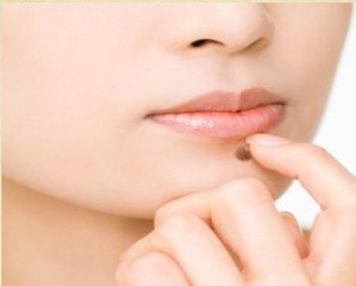
лицо с бородавкой