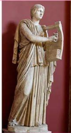
Эрато – муза любовной поэзии