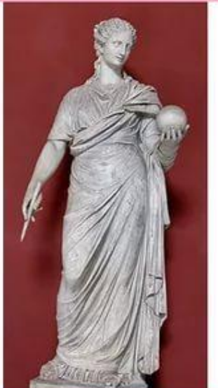
Урания – муза астрономии