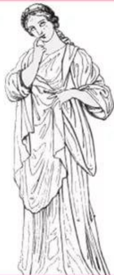
Полигимния – муза пантомимы и гимнов