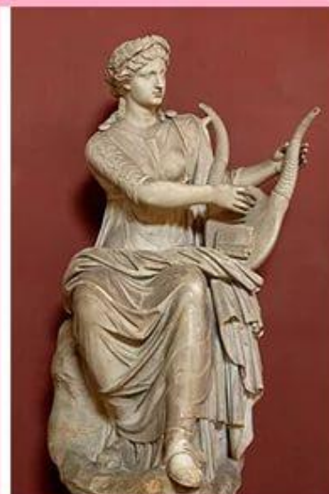
Терпсихора – муза танцев