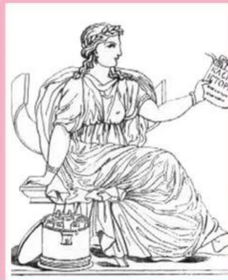
Клио – муза истории