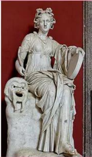
Талия – муза комедии