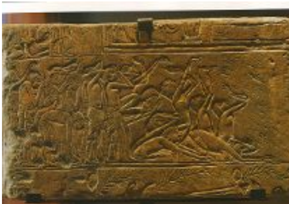
Плакальщицы. Сер. XIV в. до н.э.

В рельефе «Плакальщицы» (XIV век до н. э.) древний художник передал разную степень отчаяния и горя по умершему. Одни фигуры припали к земле, другие стоят на коленях, воздев руки к небу, третьи стоят, исполненные печали. Египетское искусство развивалось почти 3000 лет, и всегда в нем ведущей была архитектура, все остальные искусства подчинялись ей. До сих пор египетское искусство волнует людей своей грандиозностью, масштабностью и загадочностью.