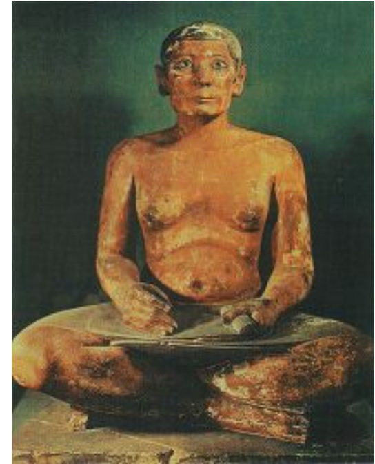
Царский писец Каи. Сер. III тыс. до н.э.

К середине III тысячелетия до н. э. относится статуя Писца. Он сидит на земле, скрестив ноги. На коленях у него лежит свиток папируса. Главное внимание скульптор сосредоточил на лице своего героя. Его глаза широко раскрыты. Белки глаз сделаны из алебастра, зрачки — из серебра. Однако, взгляд его не поймать, он обращен в вечность, а легкая улыбка дополняет ощущение незыблемости вечной жизни.