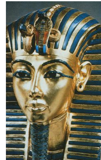
Золотая маска фараона Тутанхамона. Фивы. XIV в. до н.э.