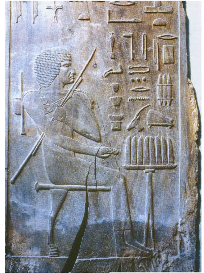
Зодчий Хесира. Саккара. 2700-2600 гг. до н.э.

Скульпторов египтяне называли « санх », что значит «творящий жизнь», ведь они создавали дом для жизни души. Чтобы душа не ошиблась, мастер должен был как можно точнее передать в статуе черты лица. А для этого он делал гипсовый слепок с лица умершего, а порой еще живого человека, если тот заранее заботился о своей гробнице.