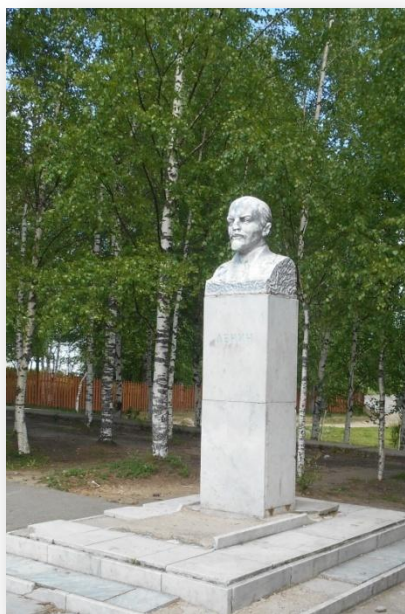
Памятник В. И. Ленину