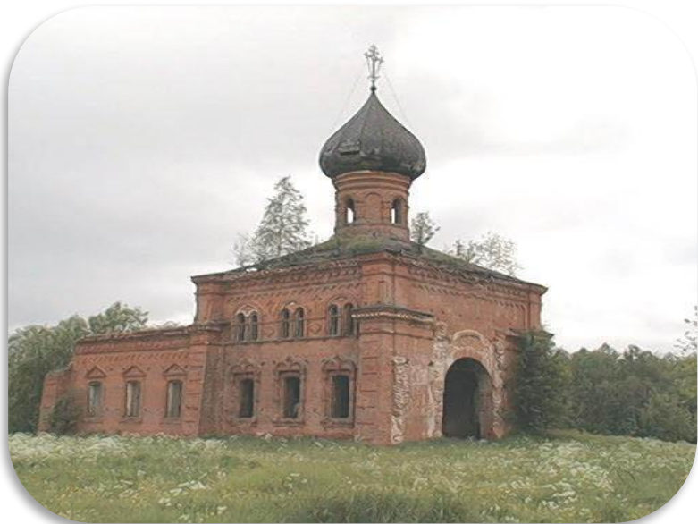
Богородицкая Марьинская церковь (д. Ихалово)