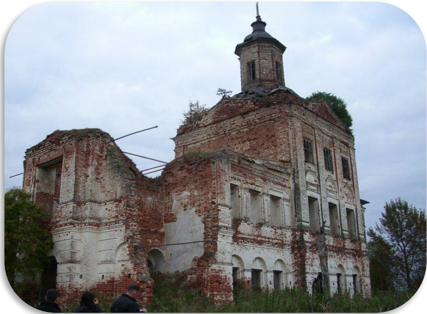
Васильевская- Кубенская церковь