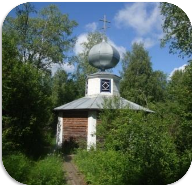
Часовня Святой Параскевы Пятницы ( д. Аниковская)