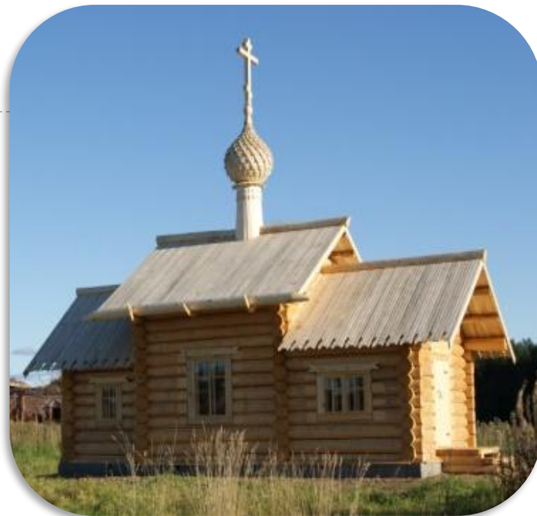
Часовня Ефимия и Харитона Сянжемских ( д. Житьёво)