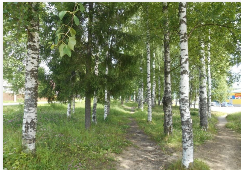
Комсомольский сквер. С. Сямжа