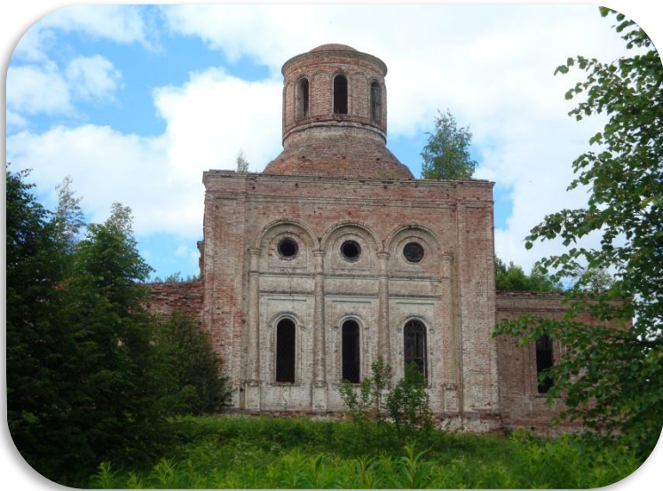
Покровская Сяменжевская церковь (д. Чижово)