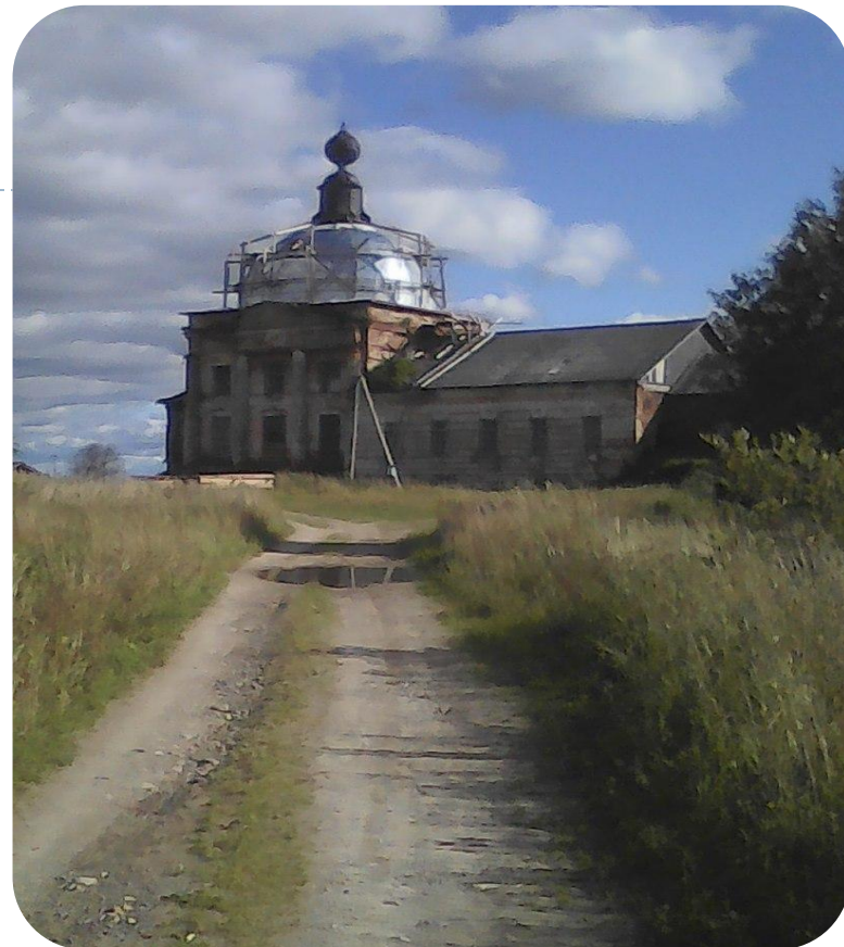
Храм Георгия Победоносца в д. Георгиевская