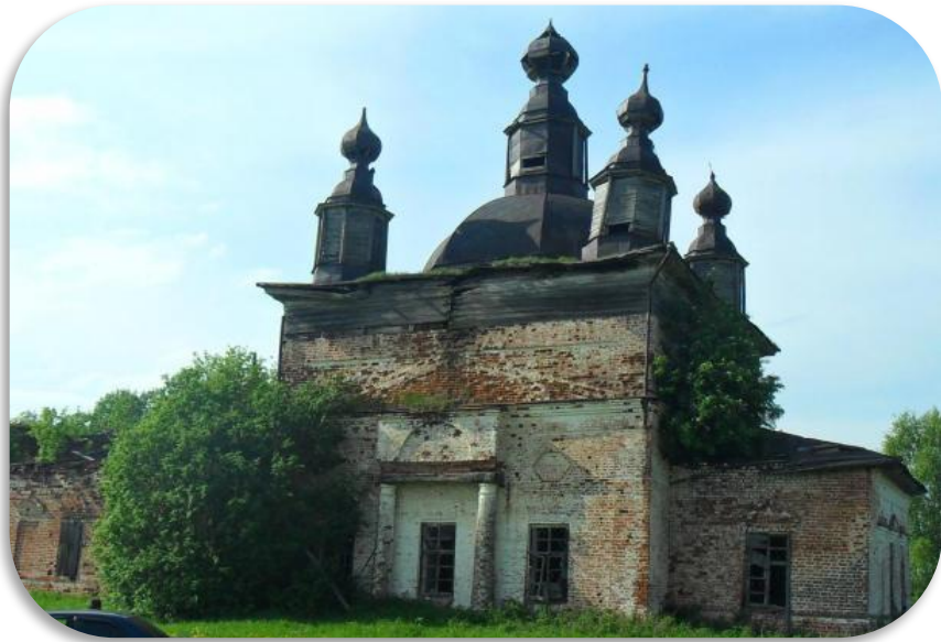
Спасо- Преображенская Вальгская церковь