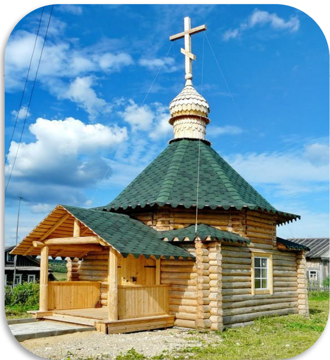
Часовня в честь Николая Чудотворца с .Усть-Река